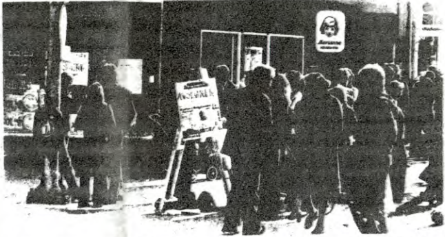
Det syntes i gata i Harstad at en huskai de fleste hadde hørt om ble avslørt i Klassekampen. 700 aviser ble solgt i Harstad forrige lørdag formiddag.

På alle steder og i alle byer finnes det et stort flertall av folk som aldri har lest eller brydd seg om å lese avisa Klassekampen. Ingen betaler over 500,- kr året for et avis de ikke kjønner, og slett ikke for et avis de ikke liker eller mener de har bruk for. Oppgaven var derfor klar: Vi måtte lage lokalt stoff som FLERTALLET av folket var interessert i å lese og der flertallet sa når de hadde lest stoffet: Dette var bra, dette trengs det at det blir skrevet om, de kjønner seg igjen i stoffet og skjønner at Klassekampen er en redelig avis som skriver sannheten og som forsvarer flertallet av folket sine interesser. — Nå er grunnlaget lagt for at folk leser resten av avisa og kjøper neste gang de får tilbud om det ... og abonnerer når de er blitt helt overbevist, om at Klassekampen er KLASSEN sin egen avis.