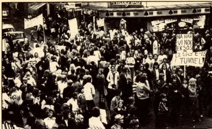
Legg storveiene utenom tettstedene.

For oss sosialister – kjennskap til dagens svinebundne kommuner og hjelpe-løst begrensete kommunalpolitikk er en kilde til kunnskap om alt arbeidsfolk må rette på – gir oss bedre argumenter for at sosialismen vil bety en kraftig og praktisk utvidelse av demokratiet for arbeidsfolk. Ser følgene i kommunalpolitikken også. Hensynsløst – alle lokale hensyn til side – arbeidere, bønder, fiskere det går ut over.