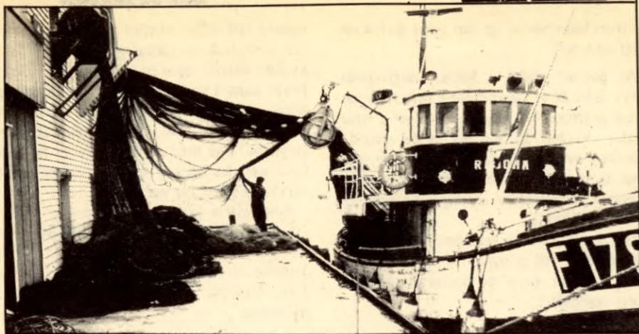
Vi krever 50-mils fiskerigrænse.

fisert med med AKP(m-l) og oppfattes som et annet navn på partilistene. 2) Det vil hindre den fulle friheten til lokalt å velge det grunnlaget som svarer best til forholda i hver enkelt kommune, velge den minimums plattform som er riktig og gjøre de allianser som er riktige 3) Dermed vil det bl.a. også gjøre det umulig å få til allianser med venstreorienterte lokalavdelinger av SV.