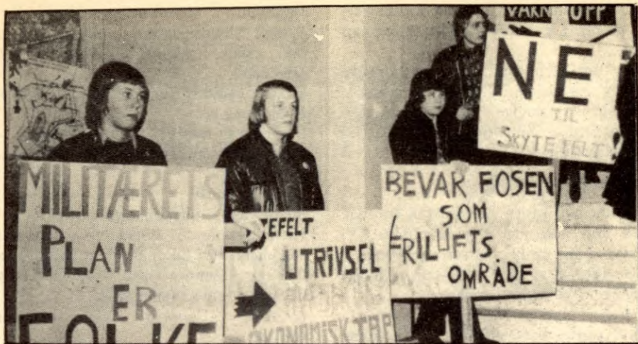
Nei til rasing av friluftsområdene.

Ingen av de gamle partiene har noen løsninger. Ikke støtte verken sentralt eller lokalt.