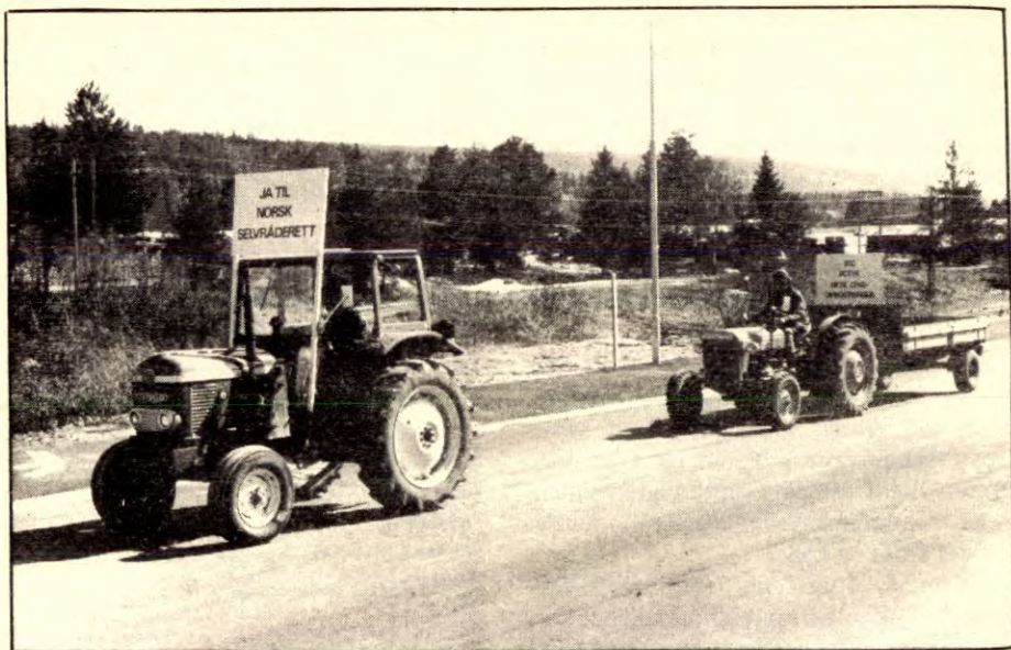
Bønder i kamp mot EEC.

Punkt h) under avsnittet »Klassene i Norge» i AKP(m-l)s prinsippprogram slår fast at »forbundet mellom arbeiderklassen, bøndene og fiskerne vil være den sosialistiske revolusjonens grunnpillare i Norge». Dette er klar tale som det hersker stor enighet om. Det er da beklagelig at vår praksis på dette punkt ikke er kommet særlig langt. Jeg vil påstå at det har vært satset nokså ensidig på arbeidere, studenter og skoleelever. Forklaringen ligger antakelig i at disse grupper er lettere å organisere og at de har bedre egnede fora for spredning av kommunistiske ideer. Bøndernes og fiskernes bosetningsmønster fører til mindre organisert kontakt mellom gruppens medlemmer, og dette vanskeliggjør vårt arbeid. Dette gir imidlertid