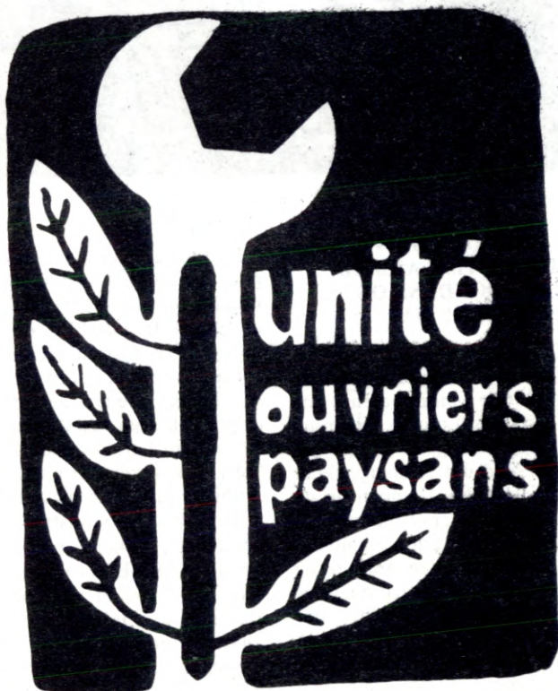
Frankrike 1968 »Enhet arbeidere/bønder!«