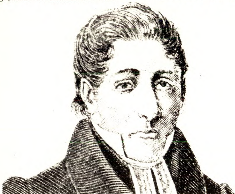
Lars Levi Læstadius.