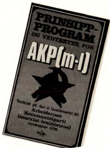
AKP(m-l)s prinsippprogram karakteriserer revisjonistene som borgerskapets støttespillere.

Da reindriftsloven var oppe i Stortinget i vårsesjonen 1977, blei dette tydelig for