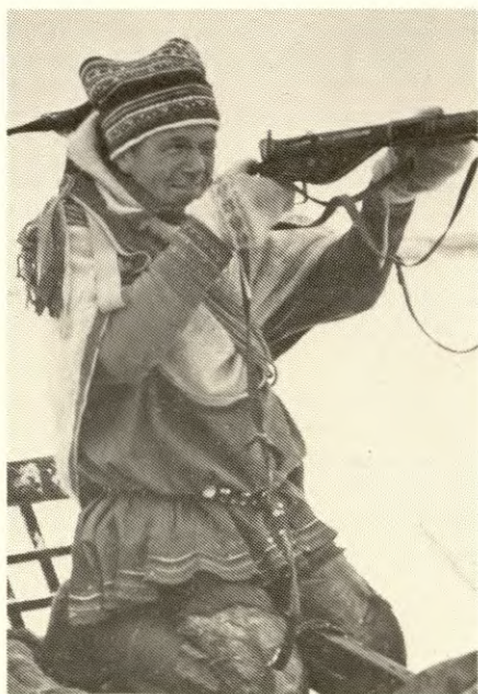
Rød Høst skildrer bl.a. hvordan nordmenn ranet samiske jaktområder.

De unge samiske disiplene til Læstadius avbrøt gudstjenester og okkuperte kirker. I denne situasjonen var det ikke mye hjelp i å sende Stockfleth. Det bidro kun til å avsløre han som en falsk «venn». Nordrás skildring av kampen fra dette tidspunktet og den videre kampen som førte fram til Kautokeino-opprøret blir såpass utførlig behandlet i den andre ar-