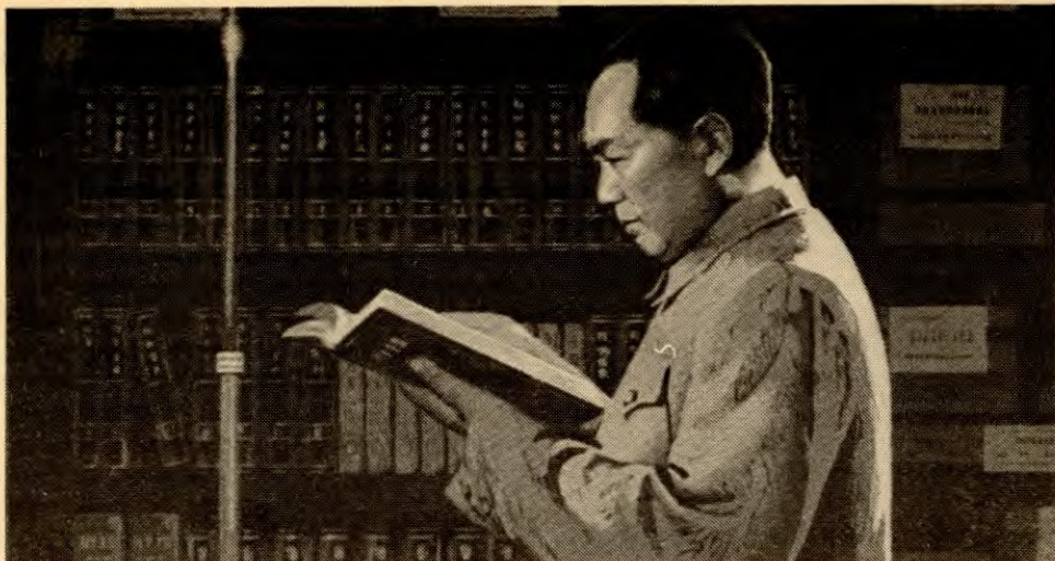
Formann Mao Tsetung.

bruk, handel, kultur og utdanning, og i hæren, regjeringa og partiet.