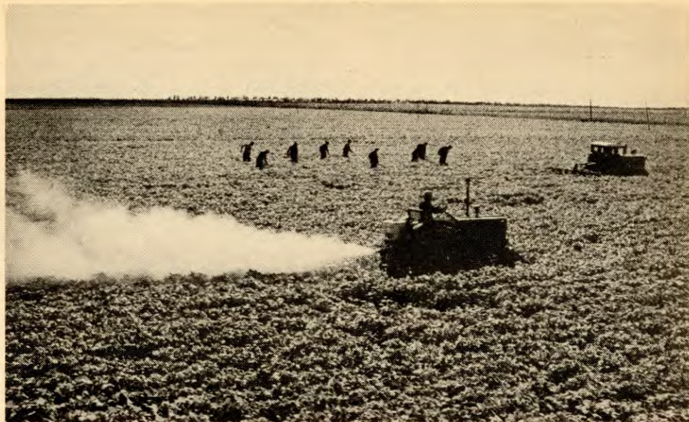
Mekanisering av jordbruket er en viktig del av planen om å gjøre Kina til et industrialisert land med utvikla økonomi til år 2000, som ble sabotert av «firerbanden». Her fra folkekommunen «Kungpang».

dustrien» og «Lære av Tachai i jordbruket».