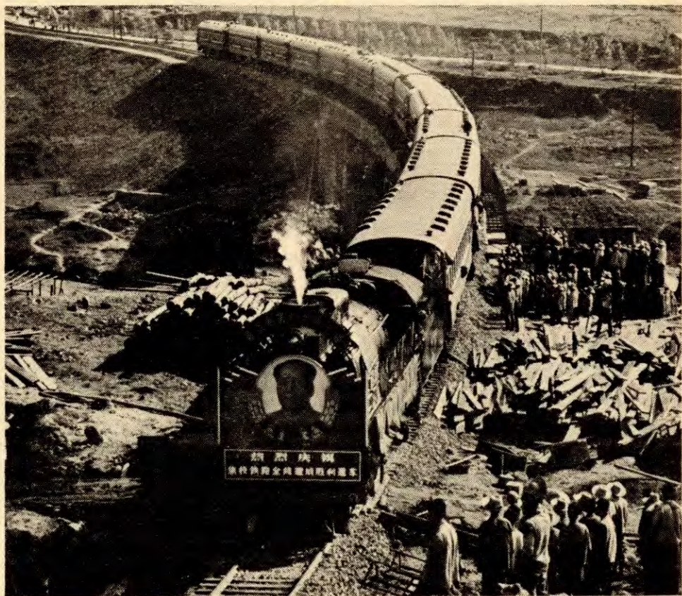
«Bedre med sosialistiske tog som går for sakte, en kapitalistiske som holder rute» var et kjent «firerbande»-slagord. Det var ei linje for å skape kaos og sabotere produksjonen. Her fra åpningen av en jernbane i Honan-provinsen.

Det refereres at «banden» sa at det er bedre med sosialistiske tog som kommer for seint enn med kapitalistiske tog som går i rute. Det er nå kjent at det øverste ansvaret for togene lå hos Teng. Med litt ettertanke kan vi skjønne utsagnet sånn: Togene gikk i rute under Teng. «Banden» dreiv propaganda for å få folk til å se på det som uvesentlig, ja mistenkelig. Toga gikk ikke i rute etter at Teng blei avsatt. «Banden» ville ha folk til å se det som o.k. Det er også kjent