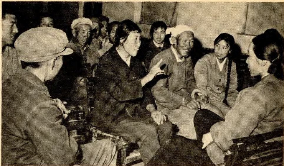
Planlegging er en nødvendig forutsetning for å kunne bygge sosialismen, «firerbanden» saboterte alt som het planlegging. Her fra et diskusjonsmøte blant bøndene i Shansi-provinsen.

økonomien går godt, men bare opp til det punkt der det ikke kolliderer med hans egne interesser av å maksimere profitten. I det øyeblikket helheten og hans egne interesser kolliderer, må han i regelen sette sine egne høyest. Åssen kan det da være snakk om noen virkelig effektiv helhetsplanlegging? Åssen kan proletariatet sikre maksimal tilfredsstillelse av hele samfunnets behov gjennom stadig økning og forbedring av produksjonen? Opplagt bare gjennom å samordne hele produksjonen stadig bedre, gjennom å økonomisere stadig bedre med hele samfunnets ressurser. (Vi skal seinere komme tilbake til hvorfor det aldri kan være snakk om å bygge «sosialisme» på grunnlag av små, gjensidig uavhengige økonomiske kollektiver slik anarkistene og noen angivelige «marxister» — trur.) Det betyr at sosialismen kan bare fungere så lenge det finnes en plan, kan aldri fungere uten plan. Det kan kort og godt ikke eksistere noe sosialistisk økonomisk system uten en sosialistisk økonomisk planlegging.