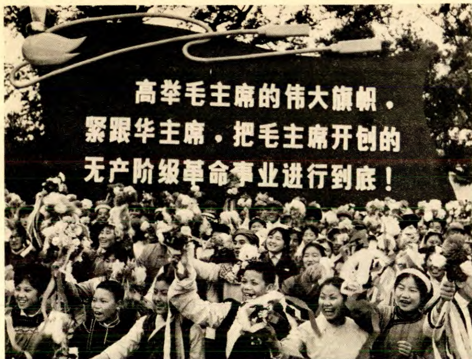
Barn fra forskjellige nasjonale minoriteter deltar i 1. mai-feiringa i Peking, under slagord som retter seg mot «firerbanden».

alle tidligere generasjoner til sammen. Undertrykkelsen av naturkreftene, maskiner, bruk av kjemien i industri og jordbruk, dampskipsfart, jernbaner, oppdyrking av hele verdensdelene, eller renska opp for båttrafikk — hvilket tidligere århundre kunne ane at slike produktionskrefter lå slumrende i det samfunnmessige arbeidets skjød?