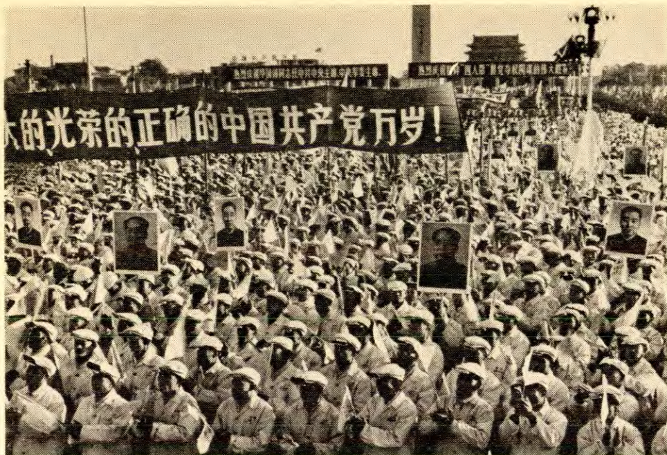
Stålarbeidere i Peking deltar i demonstrasjon mot «firerbanden».

Siste del av denne artikkelen kommer i neste «Røde Fane». Der følger avslutninga av avsnittet om økonomien, som bl.a. behandler «firerbanden» og eiendomsforholda, dens forhold til borgerlig rett og de kontrarevolusjonære konsekvensene av hele den økonomiske linja den gikk inn for . Dessuten ei sammenlikning med linja til kamerat Hua Kuo-feng som viser hvorfor det er riktig å si at formann Hua og ledelsen i KKP i dag følger ei korrekt marxist-leninistisk linje og ikke ei såkalt «pragmatisk» økonomisk linje. Og ei sammenfatning av «firerbanden»s revisjon av marxismen når det gjelder sosialismens politiske økonomi, og den skadelige virkninga det har hatt på den kommunistiske verdensbevegelsen. Helt til slutt følger et avsnitt som sammenlikner den prinsippfaste holdninga AKP(m-l) har vist når det gjelder klassekampene i Kina med de hysteriske provokasjonene som ulike revisjonistiske grupper (inklusive falske «maoister») har kommet med.