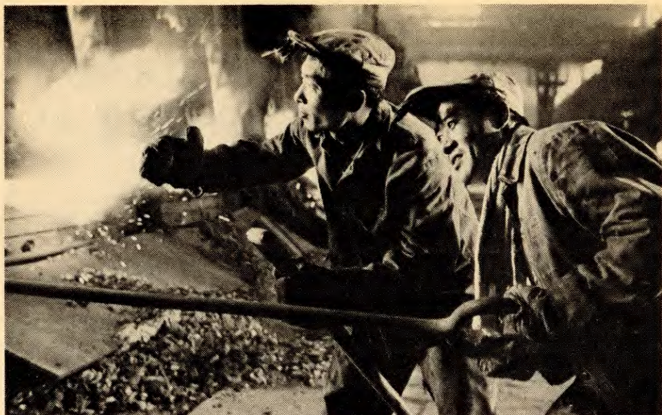
Arbeidere på Anshan jern- og stålselskap i produksjonen.

binat. Under Lushanmøtet i juli 1959 fikk sentralkomiteen ei bra melding fra dem, som uttrykte seg til fordel for det store spranget framover, for å gå mot høyreavviket og anstrenge seg til det ytterste. Den la også fram ei høy men gjennomførlig målsetting. Sentralkomiteen var umåtelig fornøyd med meldinga og fikk sendt den rundt til de kameratene det angikk med sin kommentar. De formidla den videre med en gang over telefon til sine ulike provinser, herreder og autonome områder, og hjalp slik den kampen som gikk for seg på den tida for å kritisere høyreavviket. Denne meldinga tar nok et steg framover; den smaker ikke av grunnlova for Magnitogorsk jern- og stålkombinat, men har gitt opphav til ei grunnlov for Anshan jern- og stålselskap. Her oppstår Grunnlova for Anshan jern- og stålselskap, i det fjerne østen. Dette merker av det tredje steget. Nå blir denne meldinga sendt videre til dere, og dere er bedt om å formidle den til de store og mellomstore bedriftene under administrasjonen deres og til partikomiteene i alle store og mellomstore byer, og sjølsagt, kan dere sende den til partikomiteer i prefektorene og andre byer. Den bør brukes som studiemateriale av kadrene for å stimulere tankene deres og få dem til å tenke over sakene i sine egne enheter, slik at det under rettkommen ledelse blir gjennomført ei stor marxist-leninistisk rørsle med økonomisk og teknisk revolusjon, ledd for ledd og bølge for bølge, i byene og på landsbygda i hele året 1960.