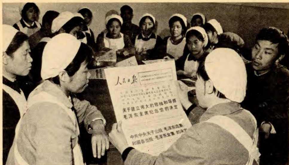
Bind 5. av Maos verker studeres nå over hele Kina. Her leser tekstilarbeidere i Peking nyhetene om at bind 5. skal utgis. Bildet er fra oktober 1976

dreiv Liu Shao-chis høyreopportunistiske linje. På det viset sikra de at partiets generallinje for overgangsperioden blei utført framgangsrikt.