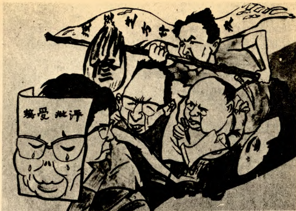
«Et falsk oppsyn». (Over maska står det skrevet «mottar kritikk». På den store vifta (CC klaga alltid på at temperaturen ikke var passende for henne) står det skrevet «revisjonisme». På banneret står det «Handle i samsvar med de fastlagte prinsipper», som var det kontrarevolusjonære slagordet til «firerbanden» og signalet for statskuppforsøket.

hører sånne historier overalt der de kommer.