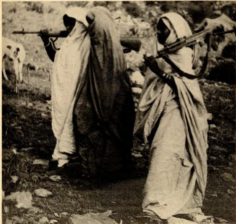
Maos teori om de tre verdener er et viktig redskap for å analysere verdenssituasjonen korrekt. Den tredje verdens kamp er i dag hovedkrafta i kampen mot imperialismen og supermaktene. Her ser vi kvinnelige frigjøringssoldater fra Eritrea som fører en viktig del av denne kampen.

het, nasjoner ønsker frigjøring, og folket ønsker revolusjon — dette er blitt en uimotståelig historisk strøm. På den andre siden er kappestriden om verdensherredømmet mellom de to supermaktene, De forente stater og Sovjetunionen, i ferd med å bli mer og mer intens. Kappestriden strekker seg til hvert hjørne av verden, mens brennpunktet for striden er Europa. Sovjetisk sosialimperialisme gjør en finne mot øst, mens den