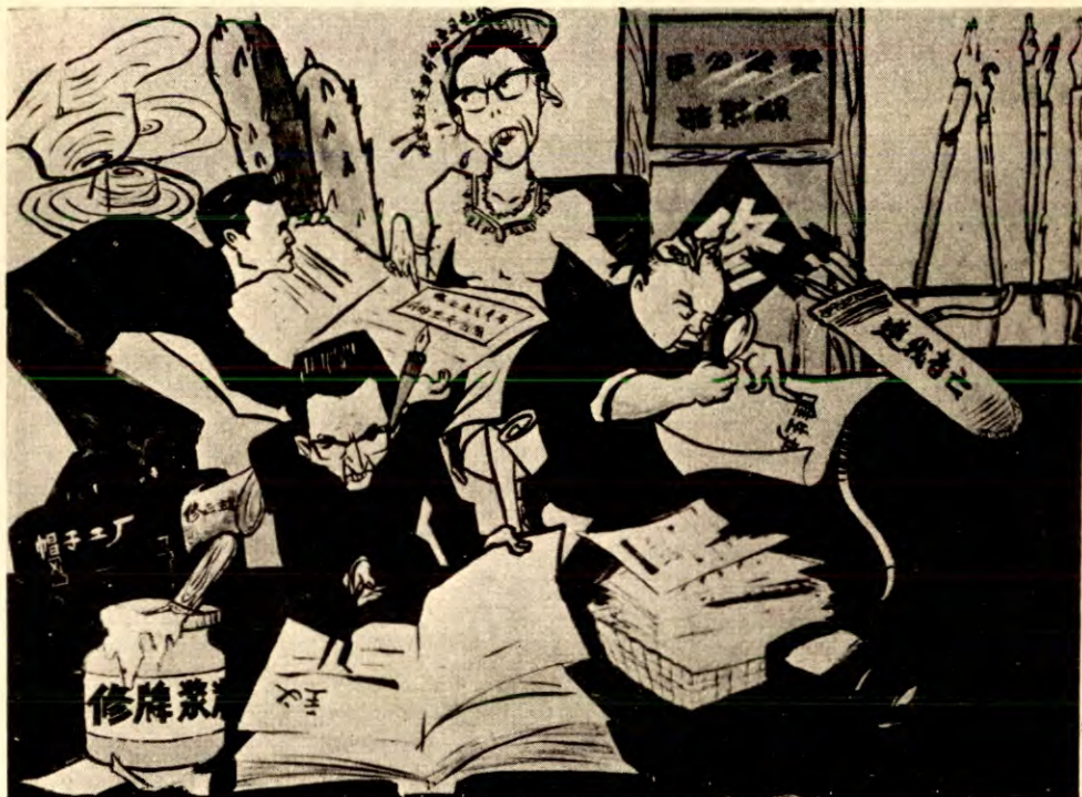
«Jernvarehandel». Ordspill som henviser til Maos kritikk av «firerbanden» om hvordan de kjørte «jernhardt» mot alle som gikk dem imot. Yao skriver en «kritikk» av «teorien om produktivkreftene». På pilkogeret står det: «utryddes skal de som setter seg opp mot meg.»

produksjonen og styrke økonomien. Både i øst og vest har borgerskapet interesse av å framstille dette som et brudd med Mao Tsetungs tenkning. For Mao Tsetungs tenkning har raskt økende prestisje i begge supermakter, i Europa og i den 3. verden. Reaksjonære i både Washington, Bonn og Moskva ser det derfor som gunstig at massene får det intrykket at Kina nå forlater Mao Tsetungs tenkning. Samtidig har borgerskapet i forskjellige land ulikt syn på om det er ønskelig at Kina styrker økonomien. En del vestlige imperialistiske land har på kort sikt små direkte motsetninger til Folkerepublikken Kina som stat . På den andre sida ønsker de å handle med Kina, og de ser Kina som en motvekt mot sosial-imperialismen. Akkurat sånn så de engelske imperialistene i gruppa til Churchill på Stalins sosialistiske Sovjet