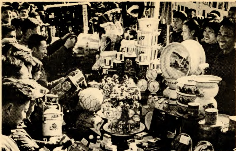
Fra et varemarked i Tafeng, Kiangsu-provinsen.

av privat kapital, sjøl om lovene forbyr det. Fordeling etter arbeid betyr altså at en svært viktig del av det borgerlige systemet overlever under sosialismen og det kan være en kime til å gjenskape kapitalismen. Likevel kan ikke sosialismen i den første tida unnvære denne formen for fordeling.