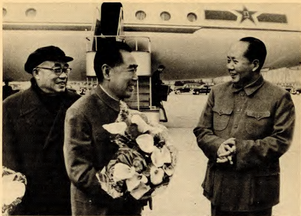
Chou En-lai var en av de fremste talsmenn for Kinas revolusjonære utenrikspolitikk, derfor ble han ut-satt for «firebandens» kontrarevolusjonære angrep. Han var en prinsippfast forsvarer for alle undertrykte folks kamp mot imperialismen. Her blir han mottatt av Mao og Chu Teh på flyplassen i Peking i november 1964 etter å ha vært i Moskva og forsvart KKP's marxist-leninistiske linje mot revisjonistene i Kreml.

å støtte verdensrevolusjonen eller slutter å vurdere verdenssituasjonen ut fra et klasseperspektiv. Kina støtter marxist-leninistiske partier og organisasjoner over hele jorda, støtter frigjøringsbevegelser og støtter sosialistiske land. Nettopp ut fra den proletariske sosialistiske verdensrevolusjonens interesser ser KKP at i dag er det aller viktigste å konsentrere kreftene mot de to imperialistiske supermaktene, skjerpe kampen mot dem og forberede folkene på krig. Om marxist-leninistene, proletariatet og de revolusjonære følger ei sånn linje så vil det føre til nederlag for imperialismen, det vil føre til nasjonal frigjøring, nydemokratiske og sosialistiske revolusjoner, til framgang for den proletariske verdensrevolusjonen. Dette betyr ikke å nedlegge kampen mot imperialismen eller klasse-