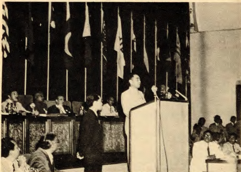
Chou En-lai på Bandung-konferansen i april 1955. på denne konferansen mellom afrikanske og asiatiske nasjoner, ble de fem prinsippene for fredelig sameksistens lagt fram for første gang. Den korrekte og prinsippfaste utenrikspolitikken til Kina ble forsvart så lenge Chou En-lai og Mao tsetung levde, den blir like prinsippfast fulgt opp av den nye ledelsen med formann Hua Kuo-feng i spissen.

Dette er morsomt, men ikke egna til å forklare hva Kina faktisk gjør. Alle som er i virkelighetens verden og ikke i en sjøkonstruert drømmeverden, veit at forholdet