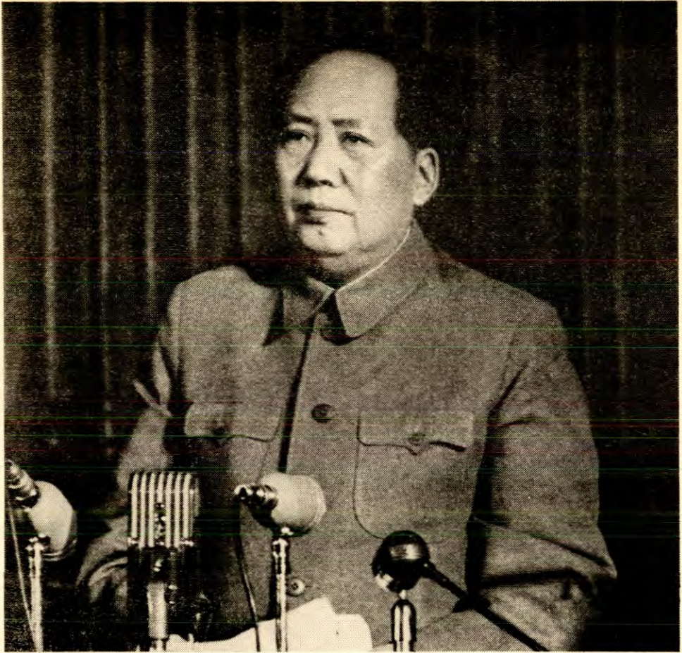
Maos artikkel «De ti viktigste forholda» fra 1956 er en eneste dokumentasjon på at Maos linje for utvikling av produktivkreftene er identisk med den linja som ledelsen i KKP i dag fører. Dette bildet av Mao er tatt i 1957.

stiller diagnosen for dødsfall for mange hundre år sida. I dag er sjukdommen — utviklinga av revisjonismen i det sosialistiske samfunnet under proletariatets diktatur — kjent. I dag er medisinen kjent: kulturrevolusjonen. Hvis vi derfor går med på den (historisk umulige) forutsetninga at en kulturrevolusjon hadde blitt starta under Stalin, så kunne også sosialismen i Sovjet vært redda.