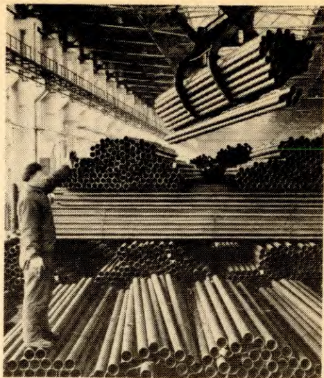
Utbyggingen av tungindustrien er en strategisk nødvendighet for å sikre proletariatets diktatur. Her fra et stålverk i Peking.

— Proletariatet og bøndene må utvikle produksjonen for å skape et overskudd som kan brukes til å utvikle de fattigste delene av Kina og viske ut de store regionale forskjellene. I Kina finnes svære områder som er spesielt underutvikla og kanskje også har særskilt ugunstige klimatiske forhold. Forskjellene i levetilstanda der og i de relativt sett rikeste og mest utvikla områdene kan være svært store. Sjølsagt betyr sosialismen i seg sjøl en forbedring for disse områdene. Men uten maskiner, utdanna kadre og de mye større overskuddene som finnes i de rikere områdene har de ikke mulighet for å komme opp på nivå med de best stilte områdene i overskuelig framtid. Om disse regionale forskjellene bare får utvikle seg, så vil det legge grunnen for motsigelser som reaksjonen kan utnytte. Det er nødvendig å utvikle disse områdene kraftig og det kan bare gjøres gjennom at det overføres store ressurser til dem. De må skapes gjennom industriproduksjon og mekanisert jordbruk.