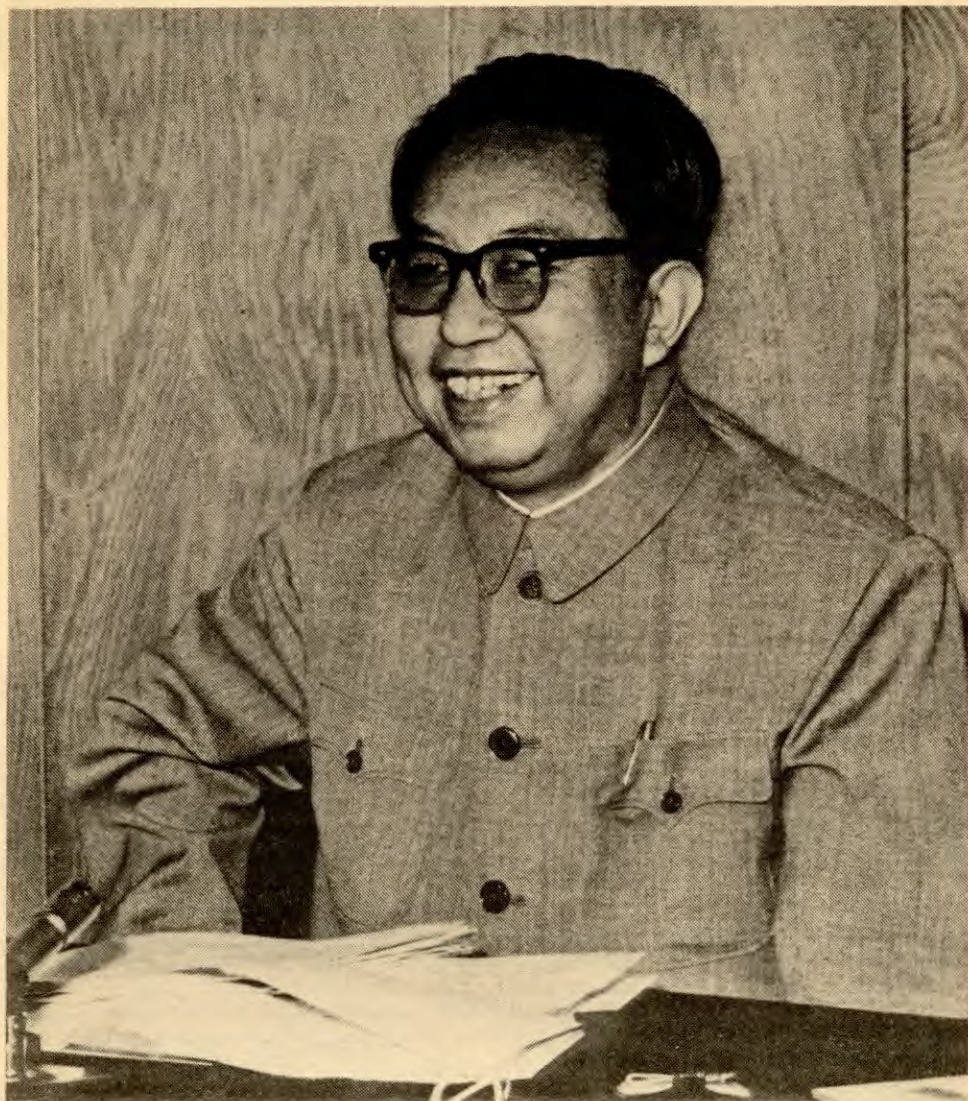
Hua Kuo-feng formann i KKP, fortsetter den revolusjonære linja til Mao tsetung.

land tar feil i noen spørsmål, uten at de av den grunn har vendt sosialismen ryggen. Forøvrig er det vår mening at Kina verken under Mao eller nå har gjort store og viktige feil i utenrikspolitikken. Tvert imot er det vårt syn at Kina har og har hatt en beundringsverdige riktig og klok utenrikspolitisk linje.