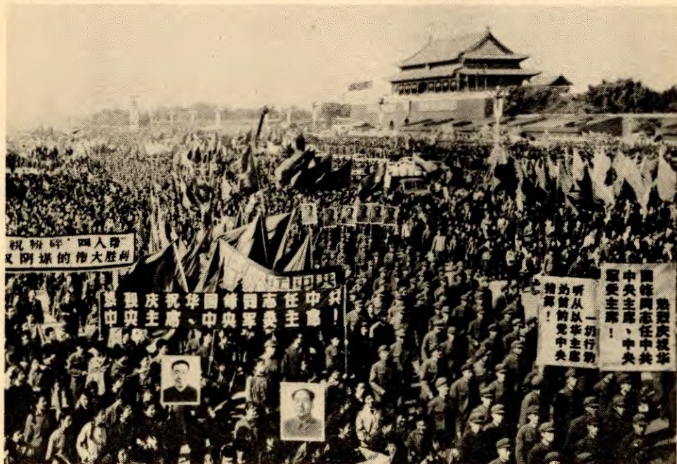
Etter at «firerbanden» ble styrtet i fjor høst var det enorme gledesdemonstrasjoner over hele Kina. Her demonstrerer soldater og sivile i Peking sin støtte til utnevningen av Hua Kuo-feng som partiformann.

I Kina gikk altså utviklinga sånn: Proletariatets diktatur, leda av KKP, blei i hoved-