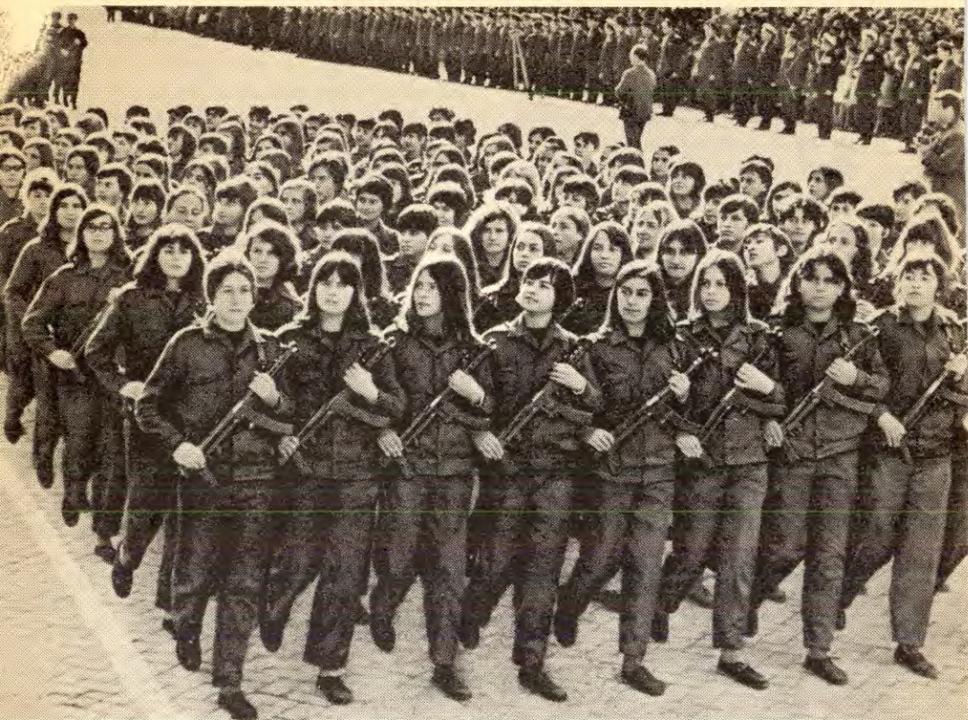
Kvinnene i Albania står vakt om sosialismen, og forbereder seg på å forsvare den med våpen i hand.

trykkinga på alle områder». I samband med 1. mai verserte det en parole, som riktignok blei dødfødt, men som likevel er et så viktig negativt eksempel at den fortjener å bli dratt fram i lyset. Den het, «Kvinner og menn, stå sammen i kampen for retten til lønna arbeid». Hva var gærnt med disse parolene?