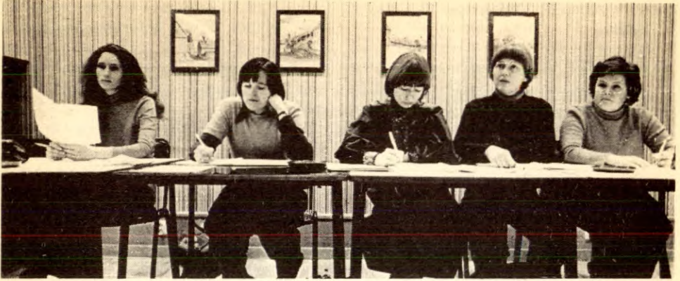
Fra pressekonferansen til 8. mars-komiteen i Oslo i november 1976. Organiseringa av arbeidet fram mot den internasjonale kvinnedagen må starte tidlig for å bygge ut en slagkraftig enhet av kvinnenes kamp. Bygg ut 8. mars-komiteene raskt.

ideologisk overbevisning. Hos oss er det tradisjon at mange barn betydde rik alderdom — og dessuten var ikke familiene tilfreds før de fikk en eller flere sønner. Vi må bruke tålmodig overbevisning for å forklare folk at familien kan planlegge annerledes nå som samfunnet tar vare på både de eldre og barna. Og vi må overbevise alle om at jenter er like bra som gutter.