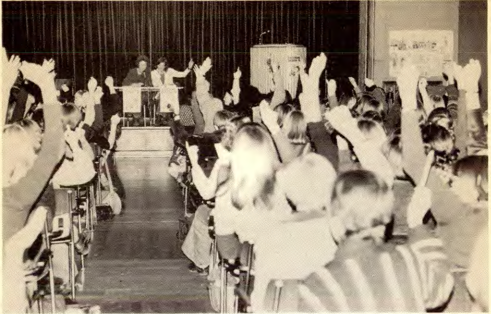
Fra Daghjemsaksjonens møte i Bergen hvor parolen «Gratis daghjem for alle barn» ble vedtatt.

De skyhøye veiledende satsene fra Norske Kommuners Sentralforbund er DNA sitt verk. De satt med flertall i dette representative organet for kommunene da satsene ble vedtatt.