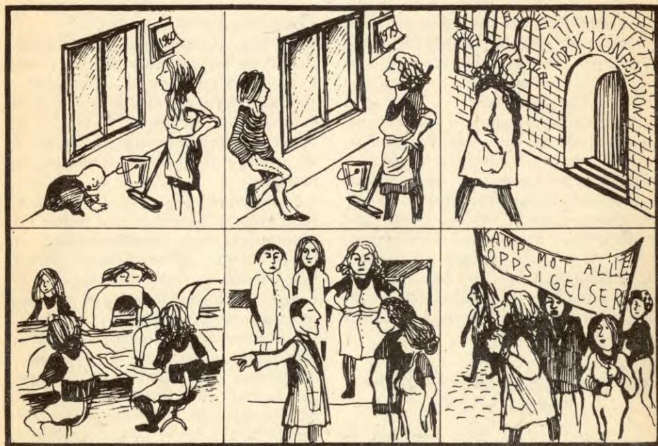
Illustrasjonen er hentet fra kvinnestudieboka, «Reis kampen blant arbeiderkvinnene».

Betyr dette at arbeiderklassens organisasjoner skal være underlagt partiet? Nei, de skal være sjølstendige organisasjoner, med sitt eget program, sin egen ledelse og sitt eget demokrati. Men det er det kommunistiske partiet — og dermed dette partiets medlemmer — sin plikt og rett å propagandere sitt partis syn, ta kamp med feilaktige ideer og linjer, delta aktivt i arbeiderklassens organisasjoner og dermed virke som eksempler i kampen, og ved å vinne medlemmene i disse organisasjoner for sine linjer, virke som ledere i kampen. Slik stiller også vi det. Det er vårt partis medlemmers plikt, menn som kvinner, å reise arbeiderkvinnene og det arbeidende folkets kvinners krav, avsløre og bekjempe den borgerlige likerettslinja, og slåss for enhet i klassen på kvinnes rettferdige kamp».