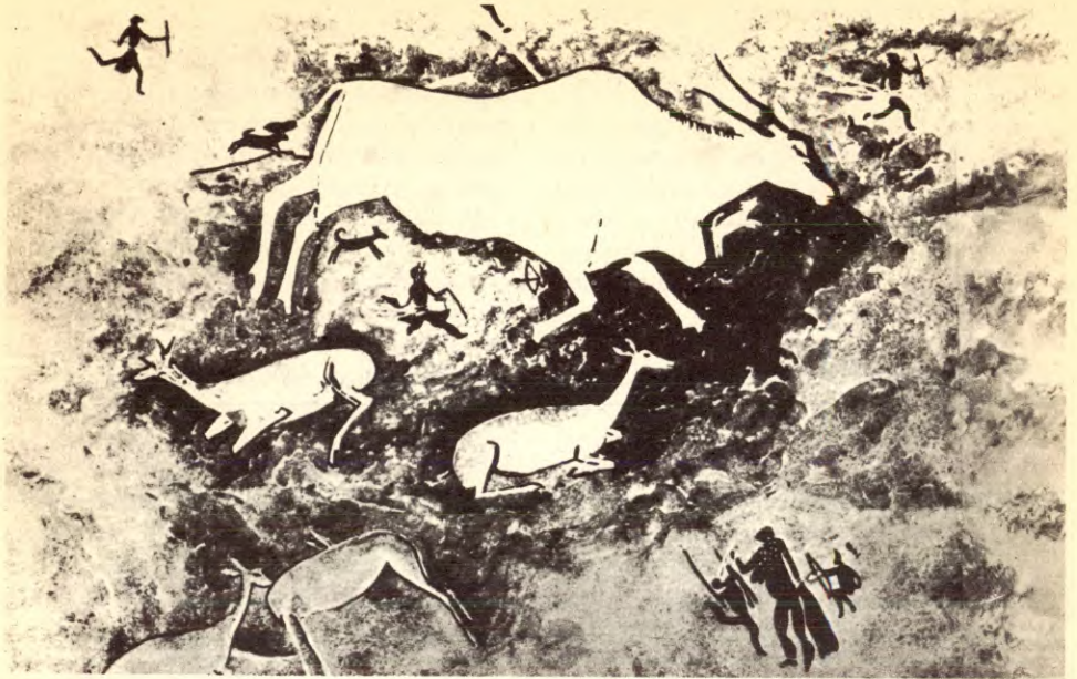
Kvinneundertrykka er like gammel som klasseundertrykka og privateiendommen. Utviklinga av produktivkreftene gjorde husdyrholdet — fanging og temning av ville dyr — til det viktigste arbeidet. Ut fra den gamle arbeidsdelinga var dette mannens arbeidsfelt. Hans arbeid blei viktigst, grunnlaget var lagt for omstyrting av morsretten. — Bildet: hulemaleri av menn på jakt, av en stamme i Kap-provinsen i Azania.

kjønnskjærligheten et stort framskritt, og den bidro til å dempe undertrykka i det monogame ekteskapet.