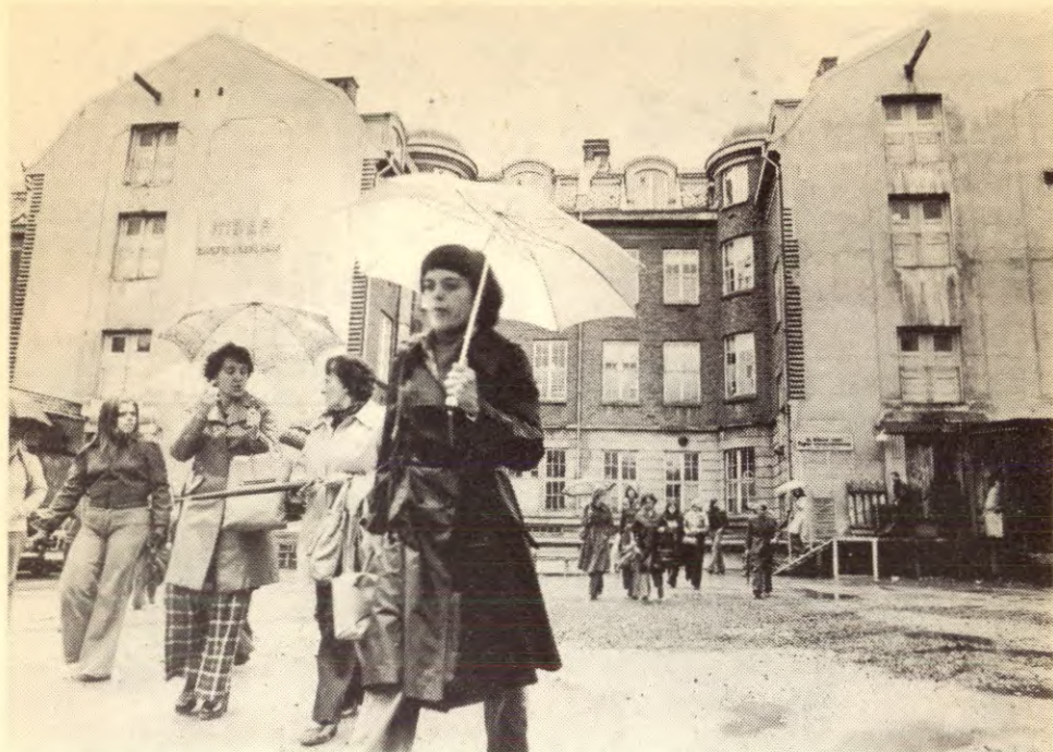
Når kvinnene reiser seg mot undertrykking og utbytting blir de møtt med oppsigelser og trakassering, slik som ved Tiger konfeksjonsfabrikk i Trondheim.

har statsmakta i ryggen i denne kampen og at de har en likeverdig økonomisk posisjon å føre kampen fra.