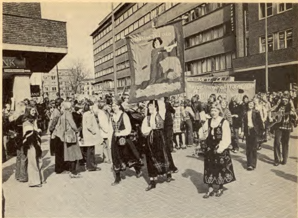
Kvinnene har sin naturlige plass i klassekamptøget 1. mai. Her er det Kvinnefronten i Oslo som har sluttet opp om Faglig 1. mai front.