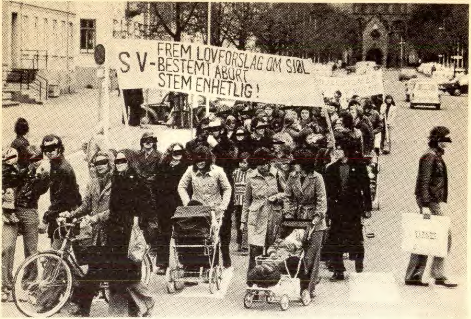
Klassekravet om sjølbestemt abort ble stemt ned i Stortinget på grunn av SVs forræderi mot egne valg- løfter. Valgflesket ble ofret for Hauglins samvittighet. Her fra en demonstrasjon i Trondheim.

kvinne — hun er like mye annenrangs arbeider og reservearbeidskraft når hun er i jobb under kapitalismen. For hennes jobb er fremdeles et «tilskudd». Slik har kapitalismen opprettholdt og ført videre kvinneundertrykkinga.