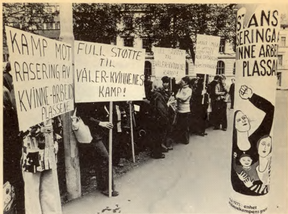
Under kapitalismen fungerer kvinnene som reservearbeidskraft, de får sist arbeid, de sparkes først når krisene setter inn. Bildet er fra en demonstrasjon til støtte for de oppsagte kvinnene ved Våler Skulag.

klare det for kvinnene. Kapitalismen er tvunget til å opprettholde en stor, arbeidsløs industriell reservearme og utvikler seg slik at stadig større deler av befolkninga blir overført dit og stilt utafor den samfunnsmessige produksjonen. Dette er ei definitiv hindring for at kvinnene kan få full og likeverdig deltaking i produksjonen under kapitalismen.