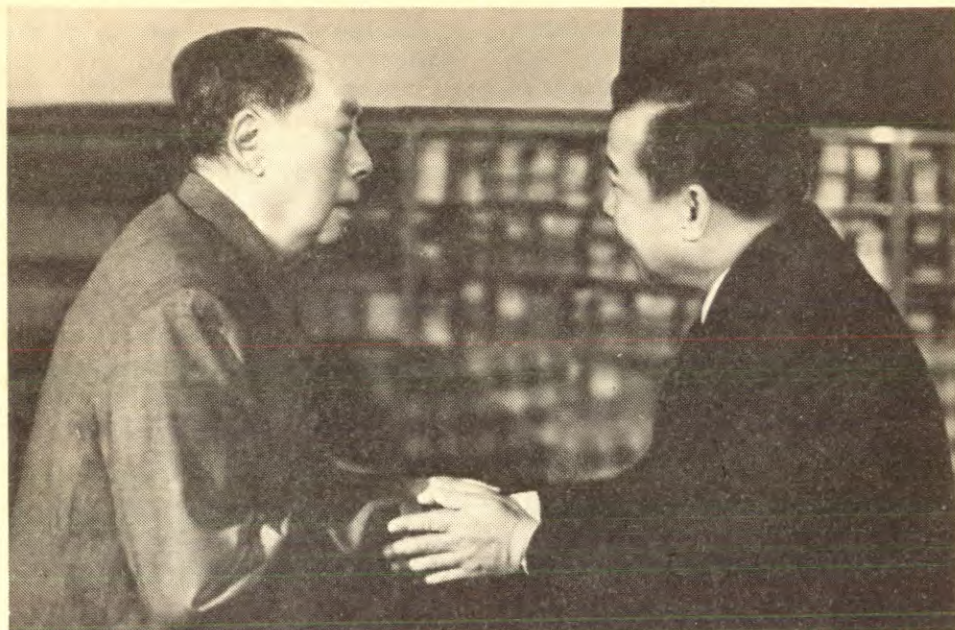
Møte mellom Sihanouk og Mao Tsetung i april 1974 under et delegasjonsbesøk fra den revolusjonære regjeringa og frigjøringsfronten i Kambodsja i Peking.

og nedkjempe imperialismen og sosialimperialismen for godt.