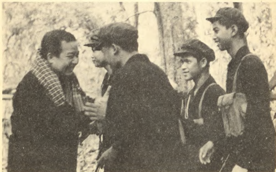
Samdech Norodom Sihanouk under sitt inspeksjonsbesøk til de frigjorte områdene i Kambodsja våren 1973.

3. Er borgerskapet eller proletariatet den ledende klassen i revolusjonen?