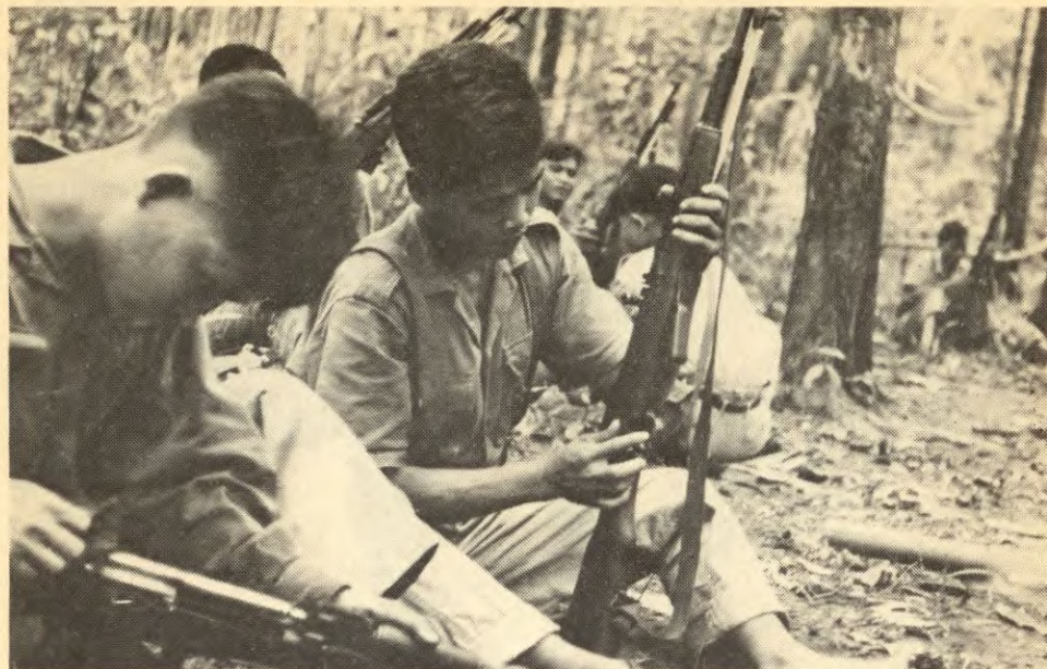
Soldater i de frigjorte områdene forbereder seg til nye slag. Bildet er fra april 1973. Da hadde frigjøringskrigen vart i tre år. To år seinere var seieren fullstendig.

farne kadre som hadde lært seg irregulær krigføring gjennom å beskytte seg sjøl og sine baser mot Lon Nols streiftogsekspedisjoner.» 24