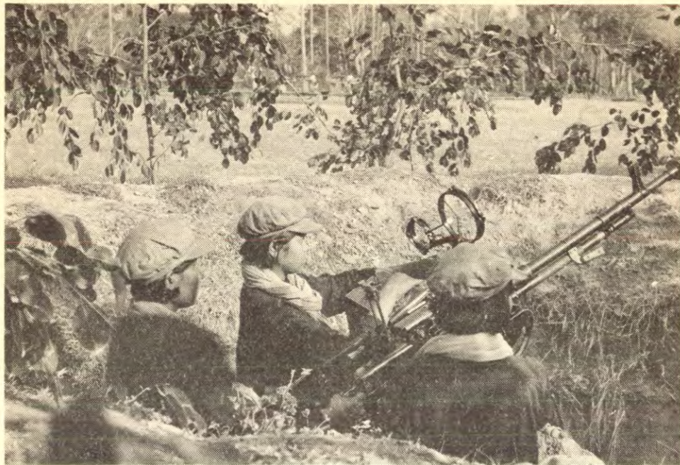
Kvinnelige soldater fra Kambodsjas folkehær i kamp ved angkor-fronten mai 1975.

lenger er demokrati allment sett, men demokrati av den kinesiske typen, en ny særegen type, nemlig nydemokrati.» 12