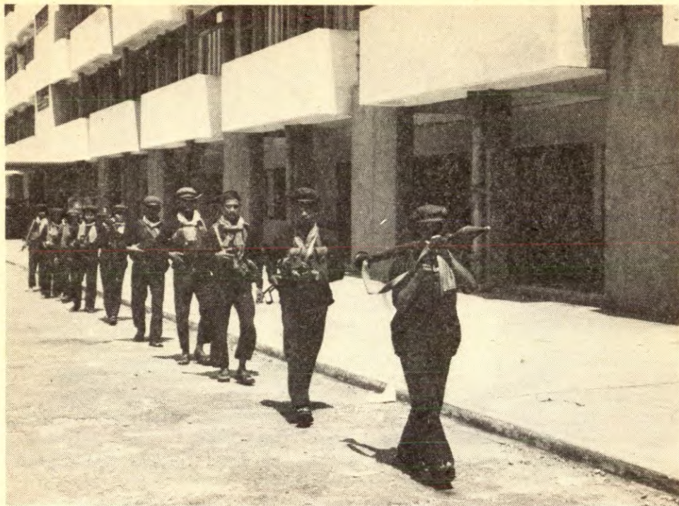
Soldater fra frigjøringshæren patruljerer i gatene etter seieren. Bildet fra mai 1975.

losji (en luksusvilla med betjening) og transport (en sjåførdreven limousine) — eller å mane til motstand. Han valgte nasjonalheltens vei.