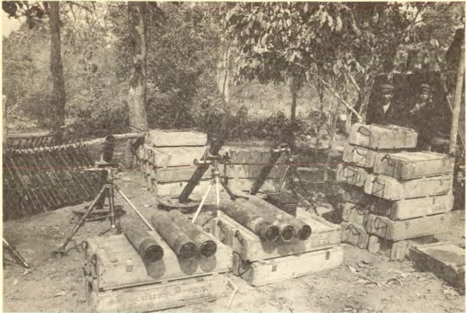
En samling våpen det kambodsjanske folkets væpna styrker vant fra fienden ved Phom Penh-fronten i april 1975. De kinesiske soldatene sa i sin tid at Chiang Kai-shek var deres beste våpenleverandør. De kambodsjanske soldatene lærte på samme måten at Lon Nol-klikken var deres viktigste våpenleverandør!