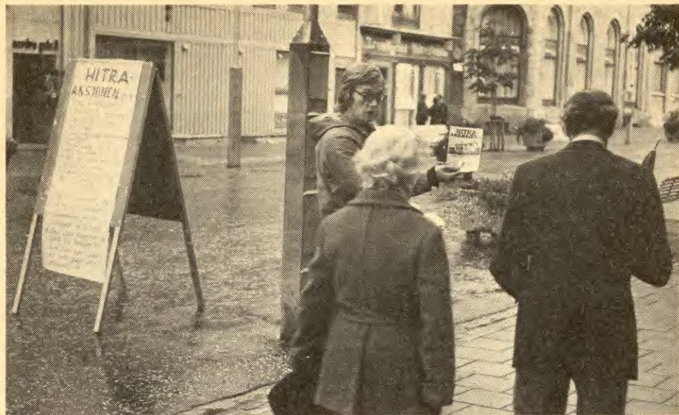
Fra støttearbeidet for Hitra-bøndenes streikekamp. Dette arbeidet var viktig for å bekjempe borgerskapets splittelsesvirksomhet mellom arbeidere og bønder og for å styrke småbrukene blant de streikende.

er svært usikkert fordi statistikken er dårlig.)