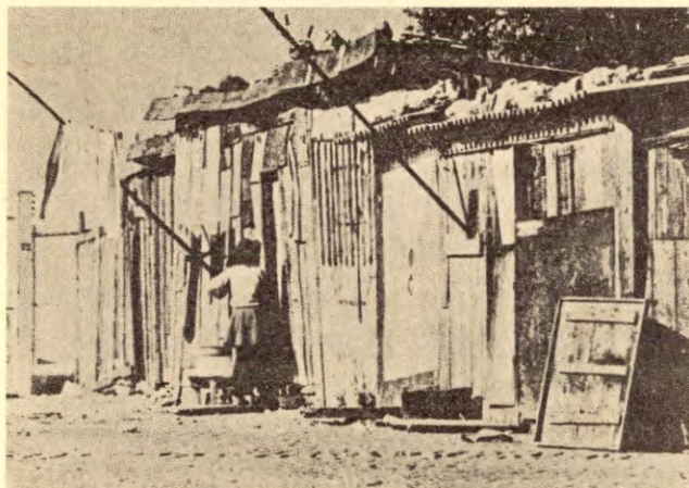
Småbrukarar og arbeidarar i fiske og jordbruk vart drivne til byane i tusental. Mange av dei enda i slike brakkebyar som på biletet.

»Då landet brått gjekk over frå å vere kjøpar til å bli ein etterspurd seljar, kunne borgarskapet auke rikdommen sin under krigen med å selje mineral, konserver, klede og alle slag halvfabrikata til begge sidene i krigen. Borgarskapet kasta seg ut i intens dyrking av bomull, kaffe og fiber i koloniane, industrien (om enn liten og dårleg utstyrt) arbeidde for full kapasitet; arbeidarane heime og i koloniane,