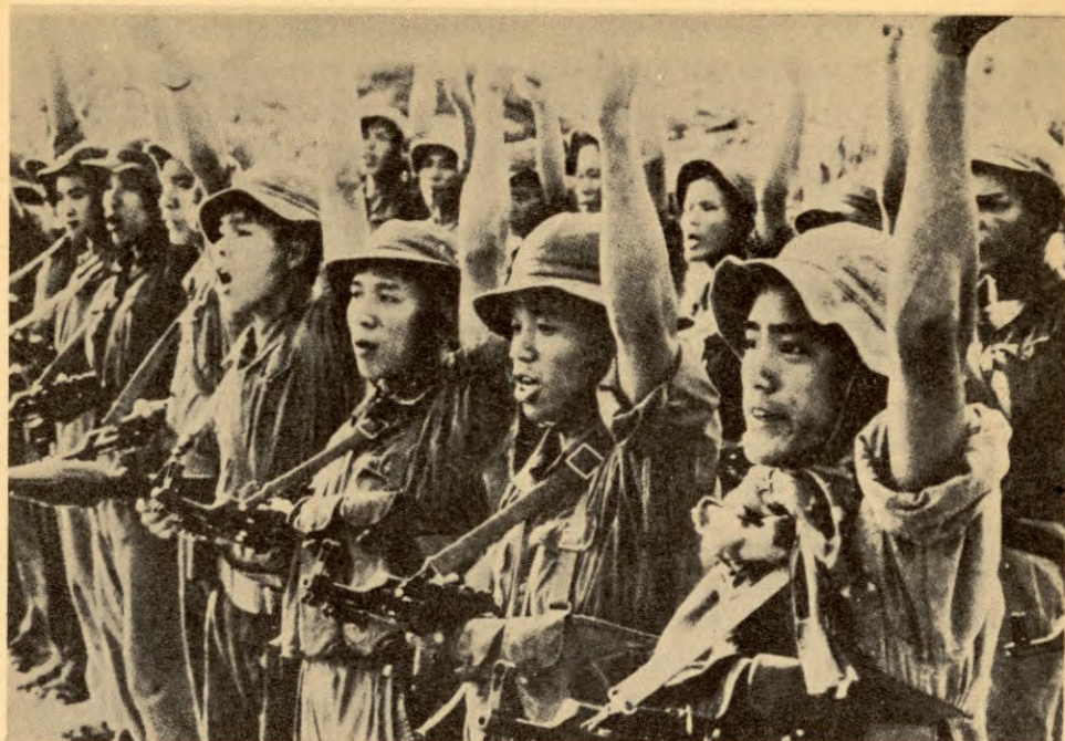
Soldatar frå frigjeringsstyrkane til FNL i Sør-Vietnam sver å kjempe til USA-imperialismen er driven ut av Vietnam og landet er frigjort. Bilete frå 1971.

De nasjonalistiske landene som nylig har erobret nasjonal uavhengighet, står fremdeles overfor den vanskelige oppgaven å befeste uavhengigheten, utslette imperialismens og den egne reaksjonens krefter, gjennomføre en jordreform og andre sosiale reformer og utvikle sin nasjonale økonomi og kultur. Det er av praktisk og livsviktig betydning for disse landene å beskytte seg mot og bekjempe den ny-kolonialistiske politikk som de gamle kolonialistene slår inn på for å holde på sine interesser, og særlig gjelder dette den amerikanske imperialismens ny-kolonialisme.