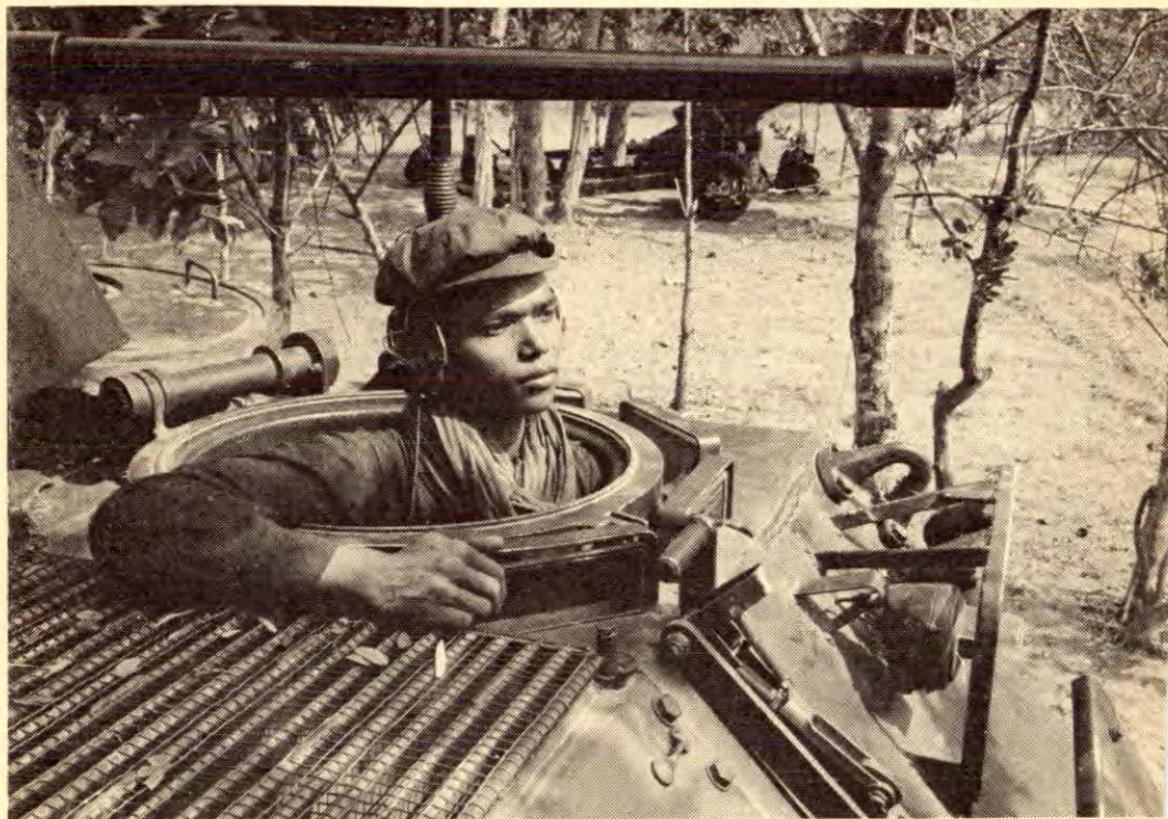
Kambodsjansk frigjeringssoldat ved fronten ved Phnom Penh i april 1975.

Den raske framgangen og den store sigeren folket har vunne i Kambodsja er eitt av dei viktigaste prova på kor vel frigjeringskampen kan greie seg utan den hjelpa sosialimperialismen stundom kjenner seg tvungen til å gje. Mest alle veit no at den einaste innsatsen Sovjet har gjort har vore sabotasje av kampen og samarbeid med folket sine fiendar. Det er nok å nemne at dei heldt oppe sambandet med Lon Nol-regjeringa heilt frå kuppet i 1970 til etter Den andre nasjonale kongressen i