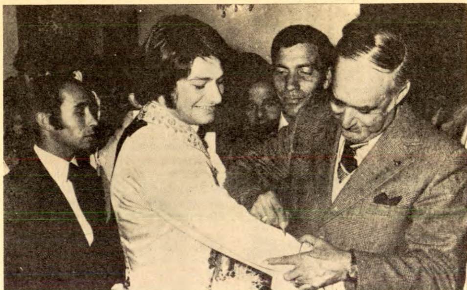
Spinola driv PR-kampanje for seg sjølv for å førebu kuppfreistnaden 28. september 1974. Her skriv han namntrekket sitt på kledda til ein av dei mest populære tyrefektarane i Portugal.

»rykk», og slett ikkje på 3 år, slik planen seier.