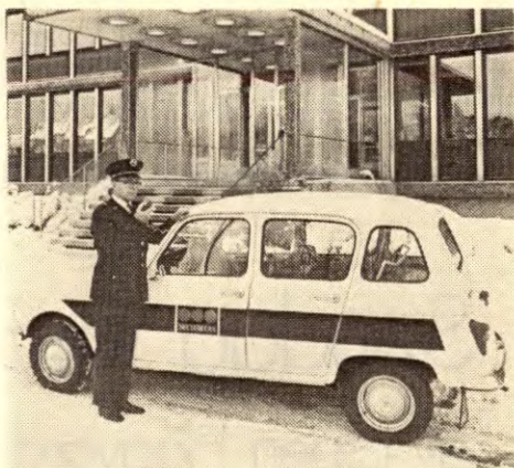
Dette og det følgende bildet er fra reklamebrosjyra »Moderne verdiforsikring» som Securitas har utgitt.

● Det er ikke mer enn et par år siden vi i norsk presse hadde en prinsipp-debatt om legaliteten av å utbygge intern TV-over-