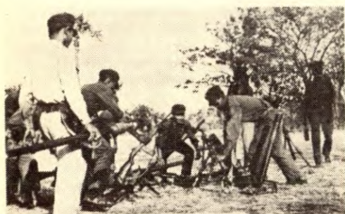
Den kambodsjanske frigjøringskampen har hatt fantastiske framganger i den snart 5-årige kampen mot USA-imperialismen og Lon Nol-klikken. (Om Kambodsja, se også artiklene «Kambodsja: Lon Nol isolert» og «Sovjet har anerkjent GRUNC» i Røde Fane 3/1974.) Bildet viser en kambodsjansk luftverngruppe i aktivitet.

Men hvorfor er ikke Phnom Penh falt? Vi skal huske på at under USAs terrorbombing strømmet det over 1/2 mill. mennesker til byen. FUNK er interessert i å få så mange som mulig ut av byen før den endelige offensiven. FUNK har en strategi i tre faser for hvordan Phnom Penh kan frigjøres. 1) Isolere byen fra omverdenen 2) Organisere motstands-kjerner i byen, flyktningene fraktes ut,