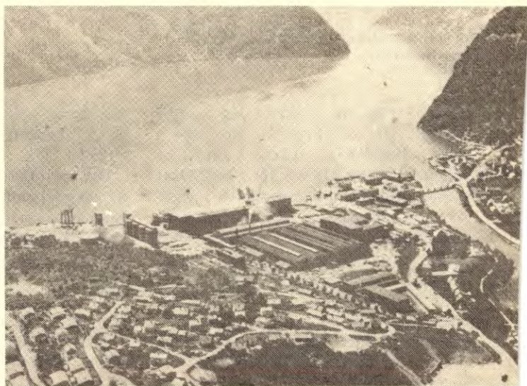
Årdal og Sunndal Verk, anlegget på Årdalstangen fotografert i 1972. I 1966 betalte Alcan bare 50 millioner dollar for 50 % av aksjene i ÅSV. I 1974 fikk Alcan 62 millioner for at staten skulle få tilbake halvparten av disse aksjene igjen.

En slik historie er det ingen grunn til å