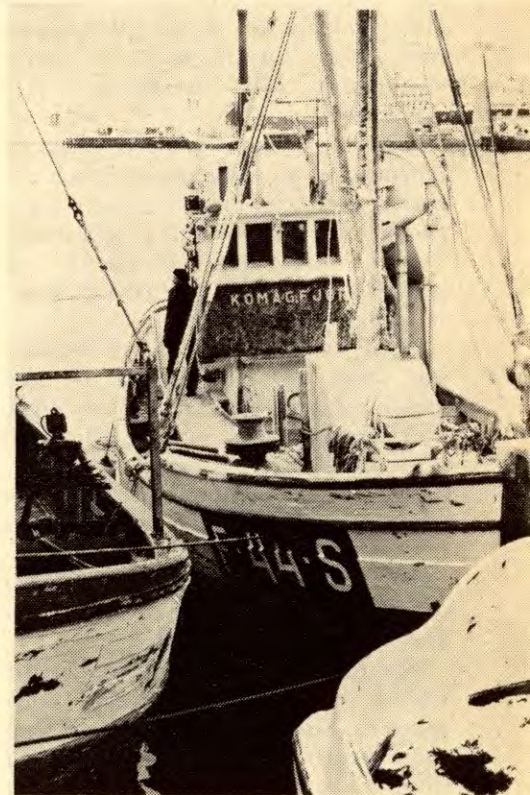
Bildeserien i denne artikkelen er fra havna i Hammerfest mens loddeflåten venter på bedring i været og rapporter fra forskningsfartøyene.

La oss se litt nærmere på de viktigste norske fiskeartene og fiskeriene. Kanskje vil noen synes dette kommer til å likne litt på en geografitime, men det får så være. Vi ser det sånn at det ikke skader med litt kunnskaper om dette. Uvitenhet tjener fienden.