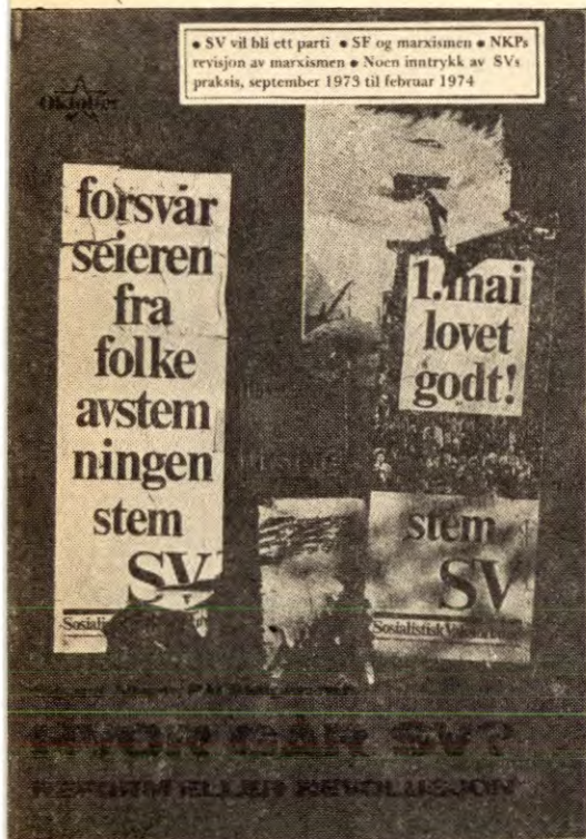
Hvor går SV? Reform eller revolusjon? 132 s. Kr. 16.

andre som vil gjenopprette kapitalismen så kan det ikke eksistere noen frihet for flertallet. Sosialismen betyr ikke opphevelsen av enhver klassestat, det betyr opphevelsen av den borgerlige staten og opprettelsen av den proletariske. Men i statens vesen ligger det jo nettopp at den undertrykker. Det kan ikke eksistere noen likhet mellom utbyttere og utbyttede, slo Lenin fast i »Den proletariske revolusjonen og renegaten Kautsky». Med sin erfaring i økonomi og samfunnsliv, sine forbindelser både innenlands og utenlands og sitt grep på den militære