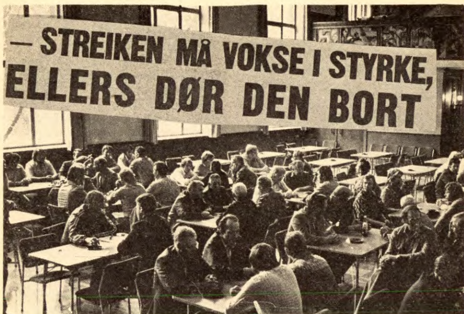
«Streiken må vokse i styrke, ellers dør den bort,» var ei parole heismontørene vedtok under streiken sin i høst. De sørger for at alle deltok i aktiviteten, la vekt på utadretta propaganda, og oppfordra til støttearbeid utenfra, og brøt helt med den passive streikelinja LO-ledelsen saboterer kampen med.

gåelig og alle legale veier er prøvd for å finne en for arbeiderne tilfredsstillende løsning, er ofte åpen konflikt nødvendig for å presse arbeidsgiverne til å godta krava. Hele lov- og avtaleverker er bygd opp omkring grunntanken at åpen konflikt aldri må finne sted i tariffperioden. Arbeidslivets tvangslover mot den norske arbeiderklassen er av de sterkeste i Vest-Europa, og har tatt fra arbeiderne streikeretten.