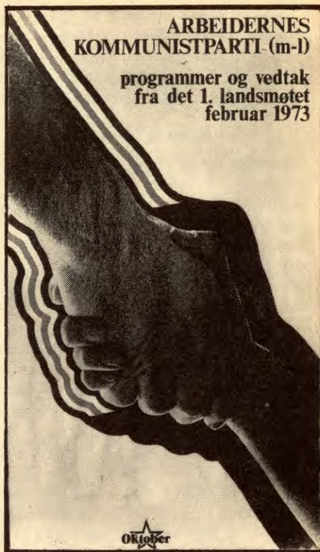
2. utgåve, nynorsk tekst. Pris kr. 18.

»Nødvendig motmakt» – alltid denne margstjælende tannløsheten. Er SV tilhenger av folkevæpning eller ei, kan vi ikke få et klart svar på det? »Nødvendig motmakt». joda vi kjenner til den fra Chile, hvor revisjonistene hadde tilgang til våpen, men nektet folkemassene å væpne seg. Joda, vi kjenner til det, man nekter ikke for at det kan trenge våpen, men