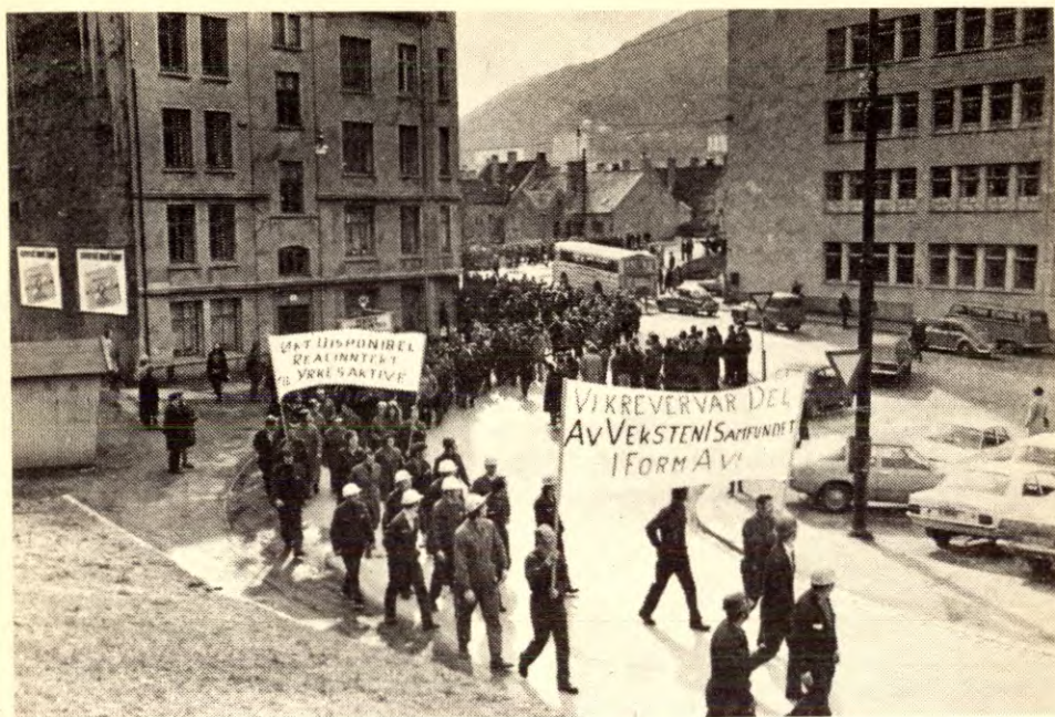
6000 deltok i toget BMW-arbeiderne organiserte i protest mot senket reallønn. Kampviljen var god ikke bare her, men i de fleste bransjer.

neker SV å påvirke resultatet. SV skal anvende marxismen på norske forhold, men fri og bevare oss for slike revideringer.