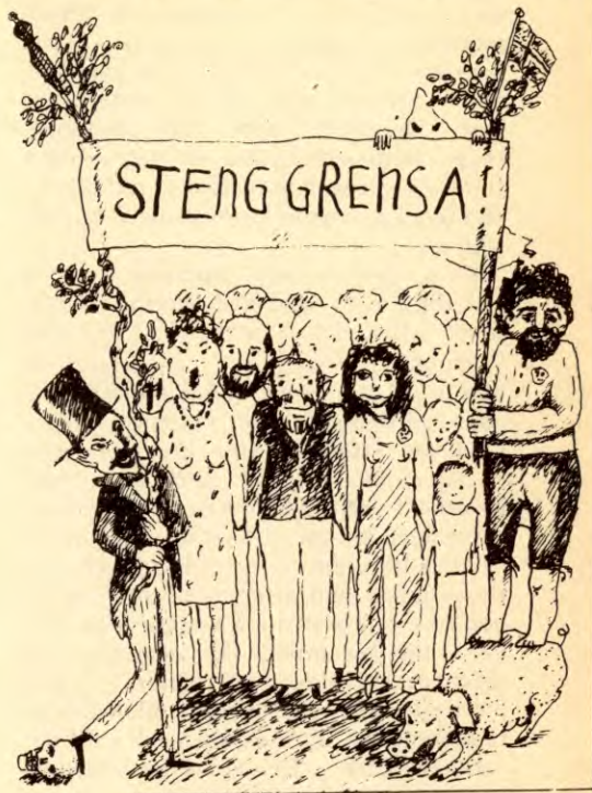
Tegning fra »Kommunistisk» Universitetslags avis Gnisten (2/74)

3. Eksport av fremmedarbeidere brukes av eksportlanda for å kvitte seg med overskuddet av arbeidskraft, men samtidig også for å kvitte seg med den revolusjonære delen av arbeidsløse. Det er svært ofte at meget klassebevisste, men dårlig organiserte arbeidere forlater sine land og søker arbeid utenlands. Landets arbeiderklasse blir tappa for sine beste folk. På den andre siden bruker monopolborgerskapet i utvikla land som importerer fremmedarbeider, importen av fremmedarbeidere som økonomisk og