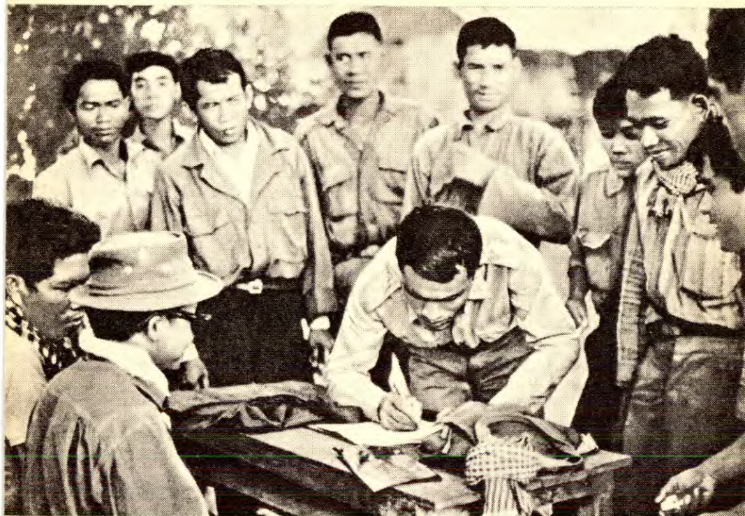
Unge menn slutter seg til frigjøringsstyrkene i Kambodsja.

Asia, og det vil være en enorm støtte og oppmuntring for folket i de andre indokinesiske landene.