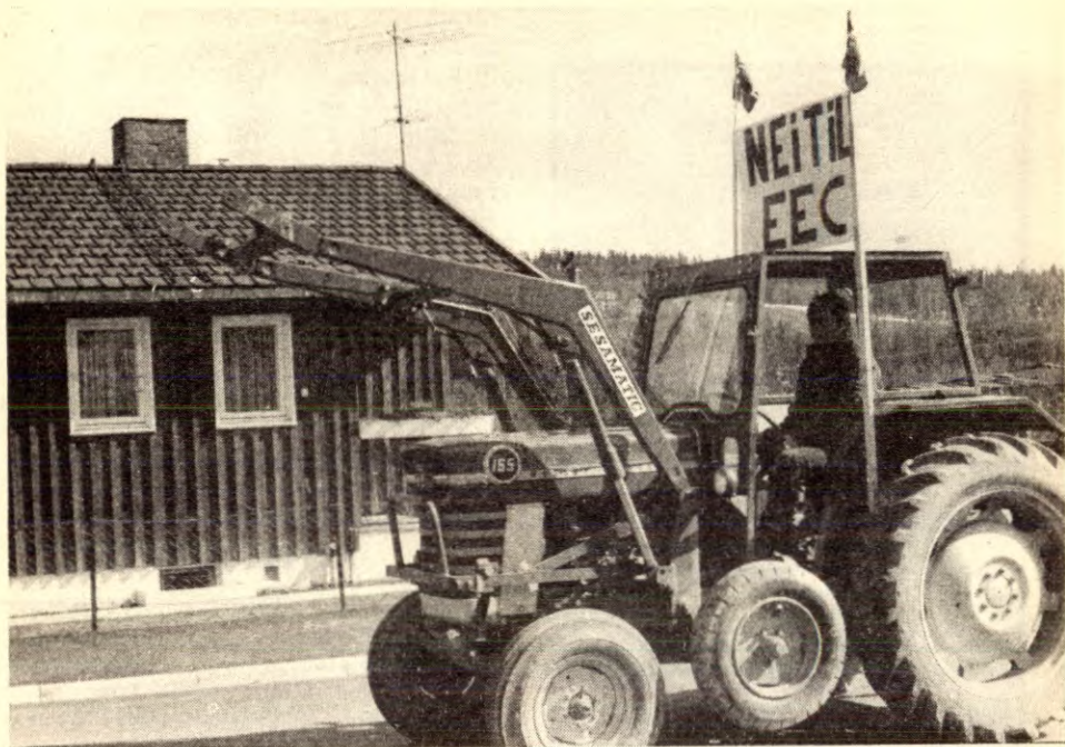
Oljeeventyret gir heller ikke det norske jordbruket noen framtid.

med den oversikt som er laget over den geografiske fordelingen av arbeidskraften som er rekruttert til plattformbyggingen, at den optimale lokaliseringen – utelukkende vurdert i arbeidskraftsammenheng – ville vært Dombås!»(8).