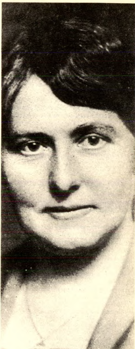
Margarete Bonnevie (1884 – 1970). Norsk kvinnesakskvinne og politiker for Venstre. Formann i Norsk Kvinnesaksforening 1936 – 46. Boka vi omtaler her, »Fra mannsamfunn til menneskesamfunn», kom i 1956.

»Det ville være galt å forsøke å forklare kvinnes undertrykkelse ut fra denne rent økonomiske tolkningen. Analysen av klassene er et praktfullt