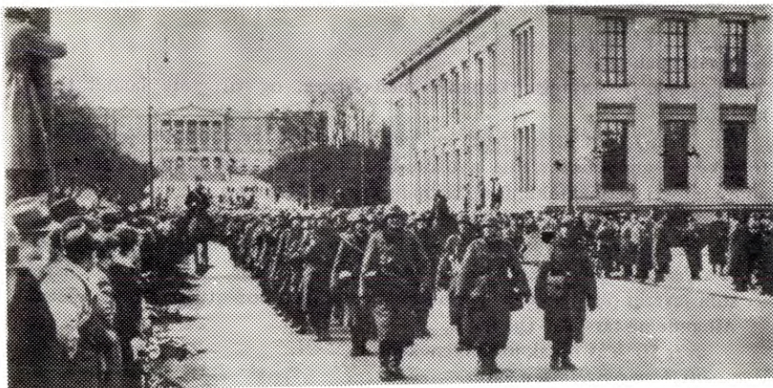
Tysk imperialisme er velkjent for det norske folk.

Slik situasjonen er ønsker Vest-Tyskland mer enn før å dominere økonomien i søkerlandene, overta markedene, skyve krisa over på oss. Det betyr at sjølstendighetstapet mer enn før er en trusel mot de norske arbeidsplassene.