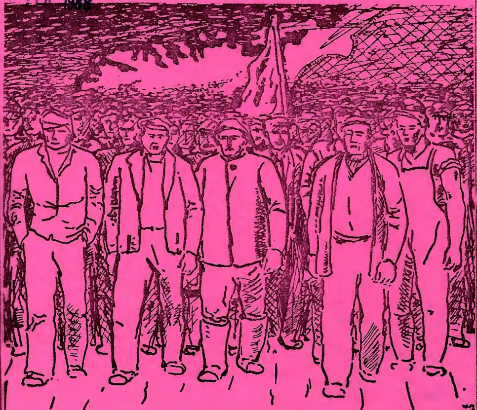
TEGNING AV WILLI MIDELFART