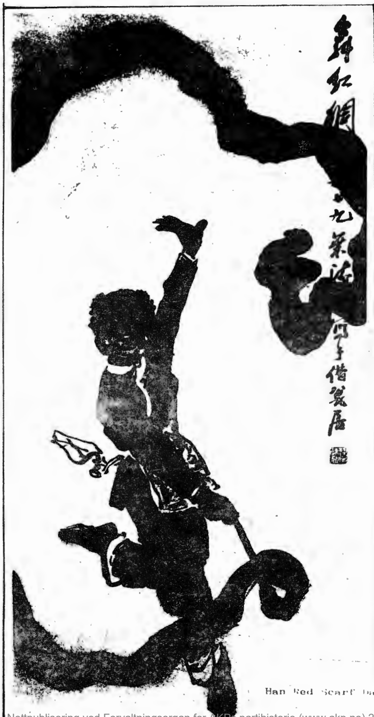
Han Red Scarf Dance (1979)