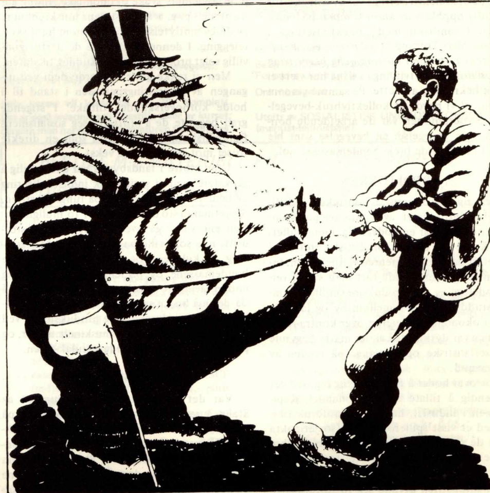
Her er der behov for å spenne livremmen inn! (Tegning fra NORSK KOMMUNISTBLAD, 16. juli 1928).

I DNA- og LO-ledelsen var revisjonismen – og klassesamarbeidet allerede dypt grunn-