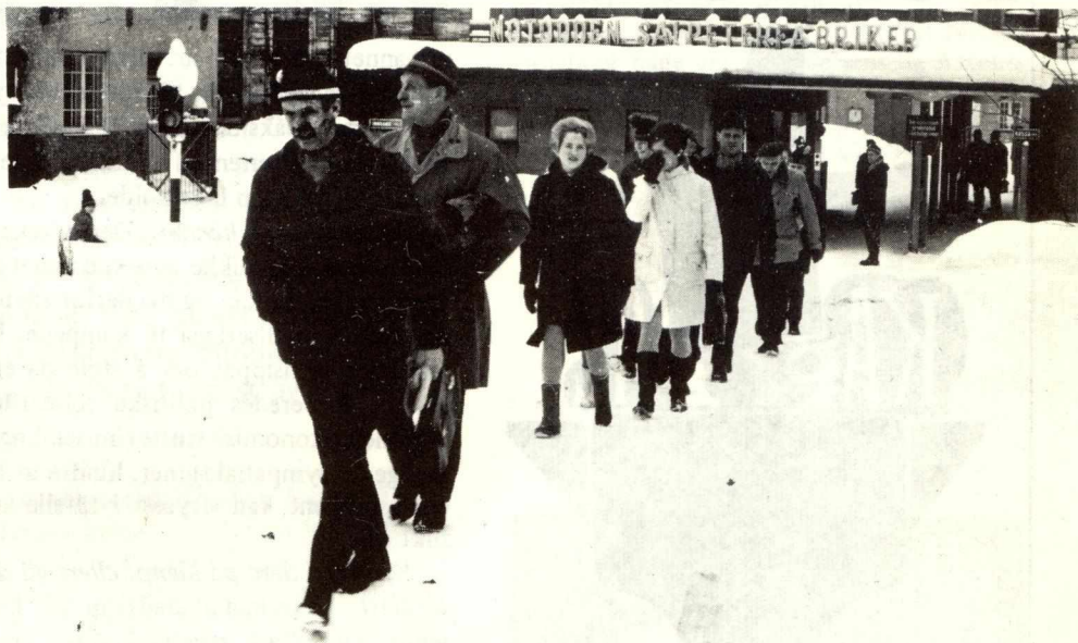
Arbeidere på veg ut fra Notodden Salpeterfabriker.

Men kommuneplanene har heller ikke vært snau med å bruke arbeidsfolks skatte-