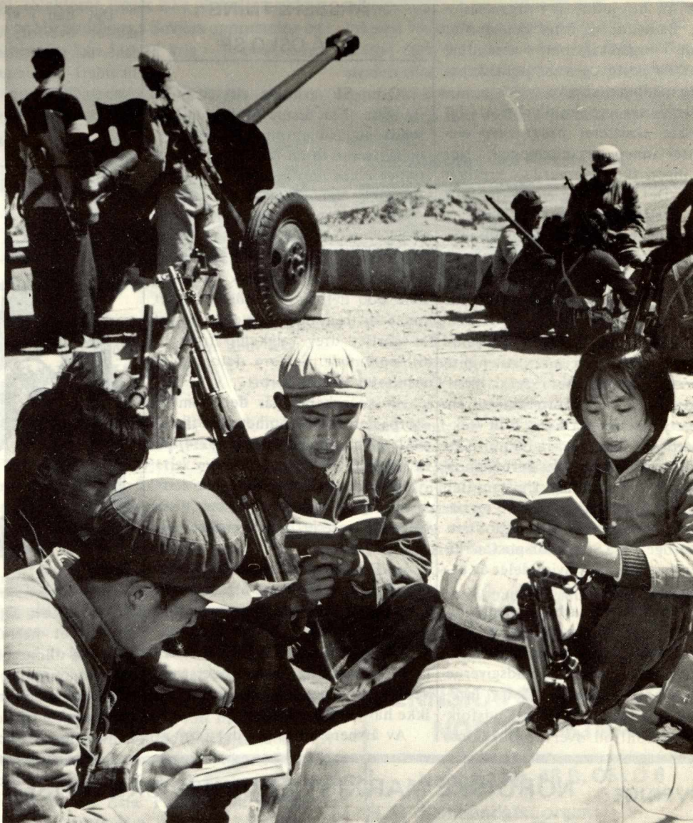
Politiske studier er en viktig del av Kinas forsvarsforberedelser.