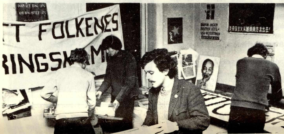
FNL-aktivister forbereder Vietnamuka.

Trenger du opplysninger eller materiell så kontakt lokale FNL-grupper eller Solidaritetskomiteen for Vietnam, boks 558, Vika, Oslo 1.