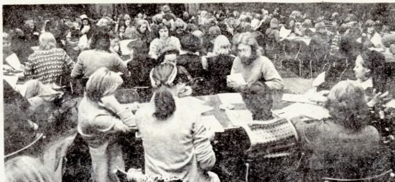
BILDET: Over 400 SEF-medlemmer møtte fram til møtene mandag. Det var langvarige diskusjoner både i plenum og

vedtaka ble fatta av en konsolidert medlemmer