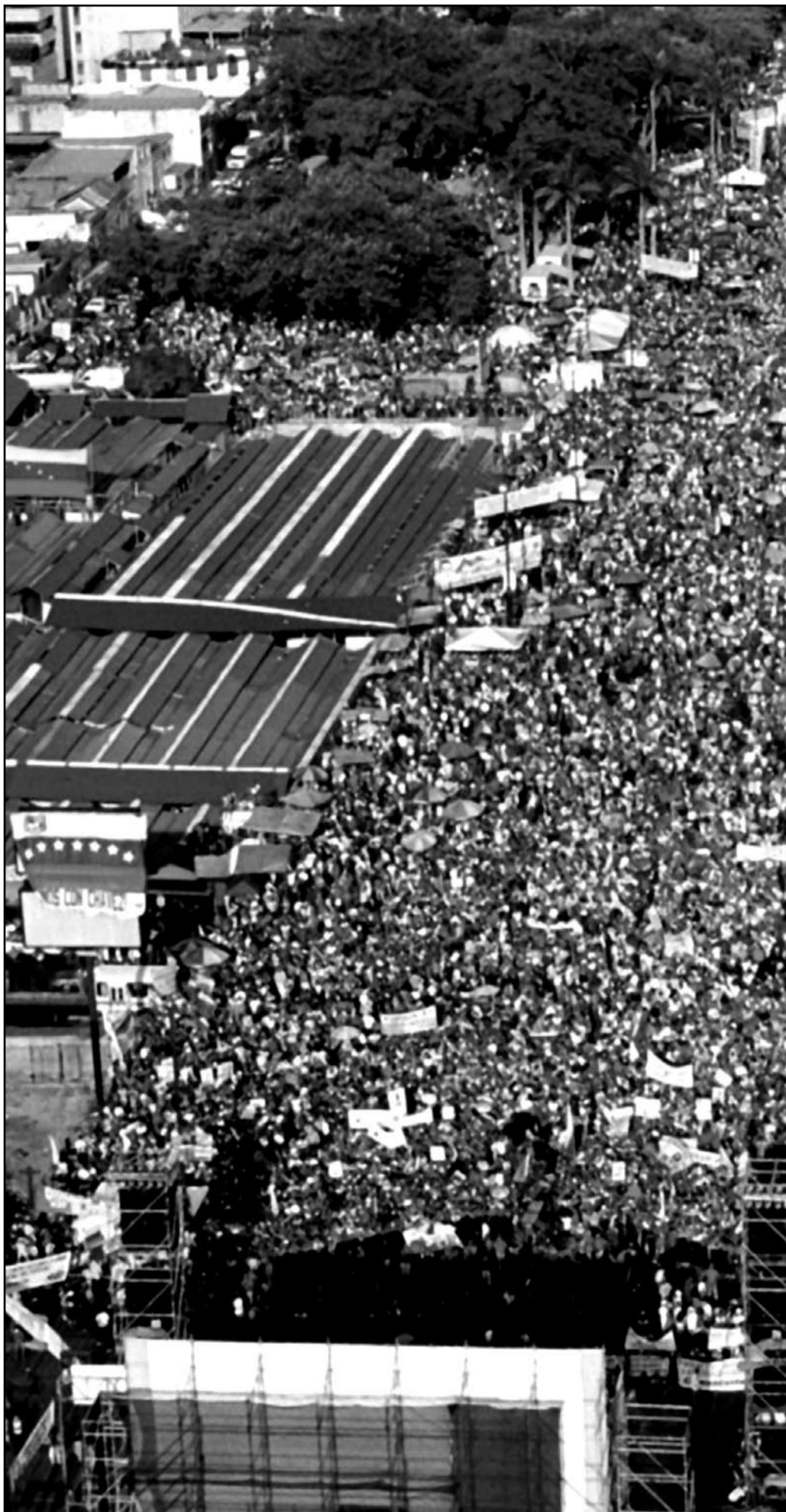
Fra støttedemonstrasjon for Chávez

Chávez prioriterer dessuten å styrke Latin-Amerika i forhold til USA i økonomien. Han satser aktivt på å bygge opp de økonomiske forbindelsene med andre land i Sør-Amerika. I sommer