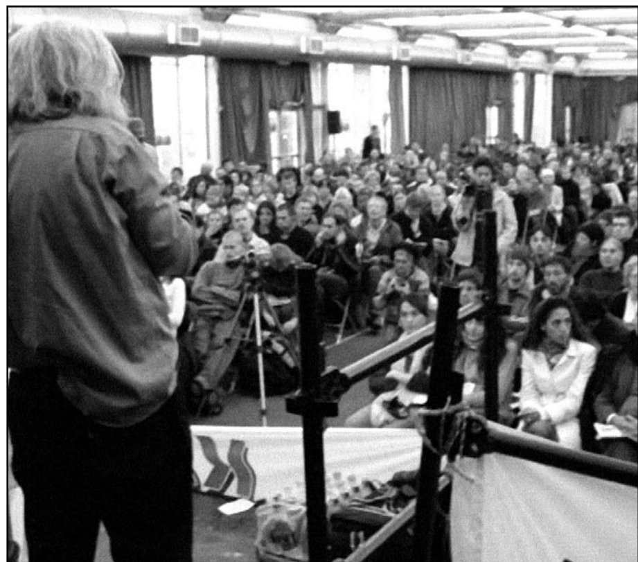
Europas sosiale forum

Neste ESF skal være i Aten. Der er både motstanden mot EU og støtten til frigjøringskampen i Irak sterk.