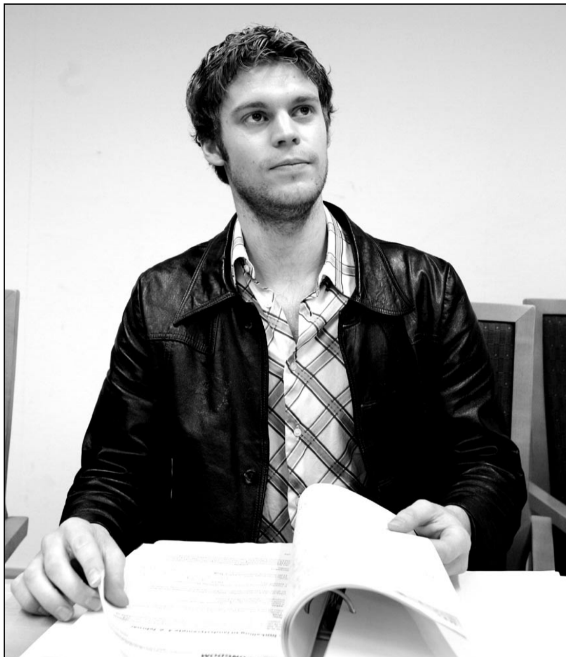
RU-leder Bjørnar Moxnes i Høyesterett.

Rød Ungdom trenger økonomisk hjelp. Vi oppfordrer alle til å gi penger for å betale boten. Send store og små innskudd til kontonummer 0530 27 47913.