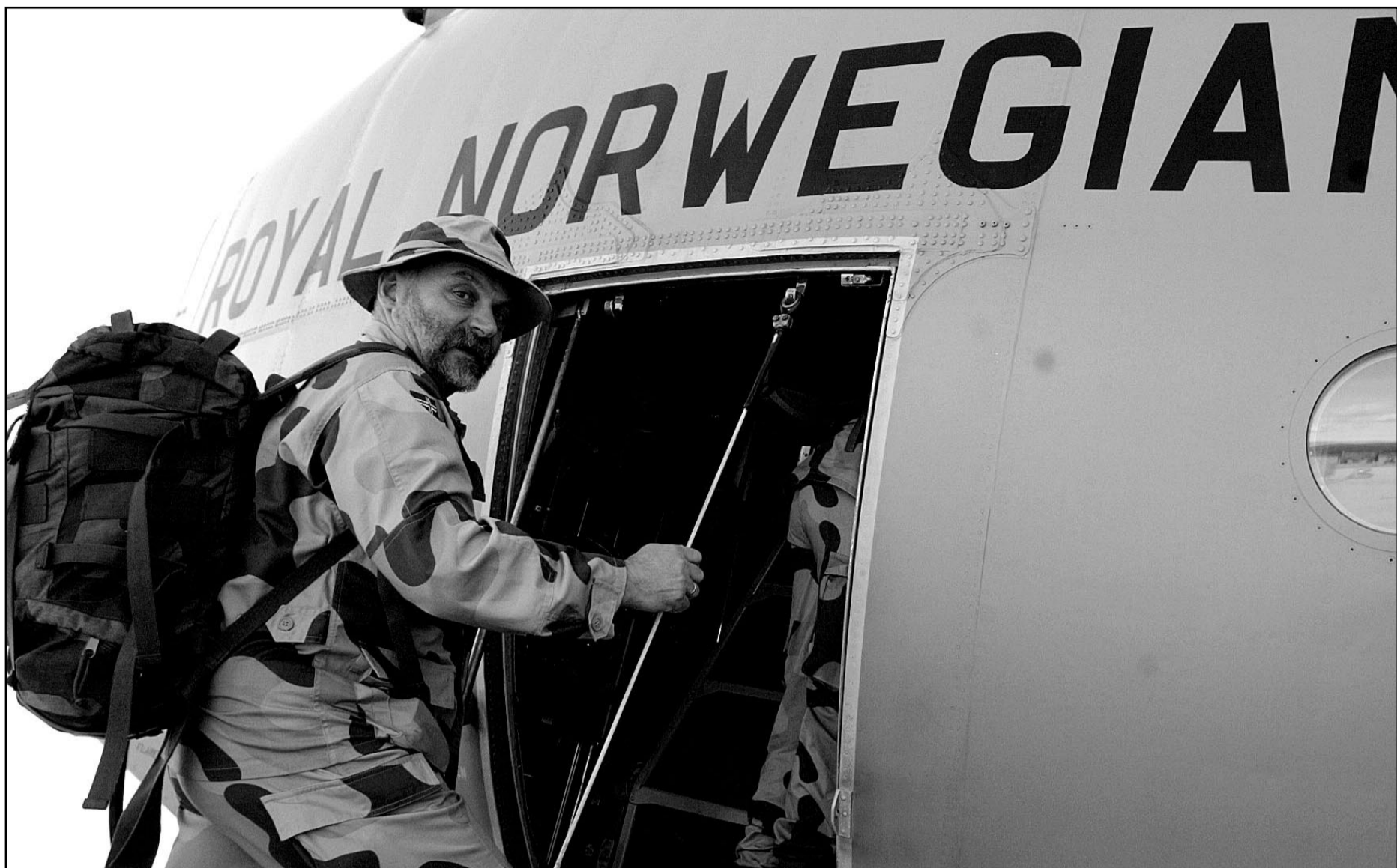
Norsk offiser på veg til Irak.