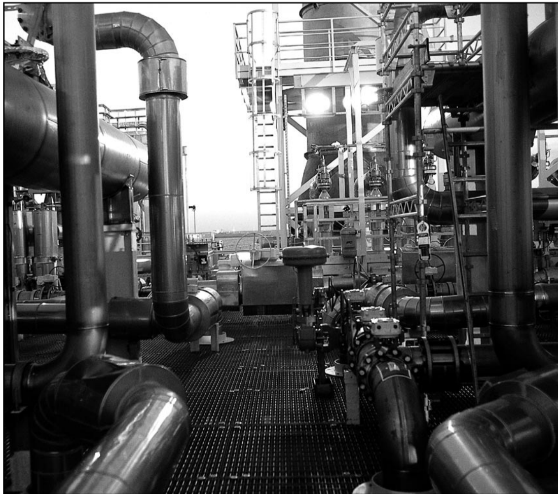
Det står stille ...

De som lever av å utbytte andres arbeidskraft, vil sjølsagt ha vekk de nasjonale reglene for å kunne gjøre nytte av det lavest mulige nivået som finnes innafor EU. Det er EU-kommisjonens uttrykte mål. De vil ha billigst mulig arbeidskraft for å vinne konkurransen med