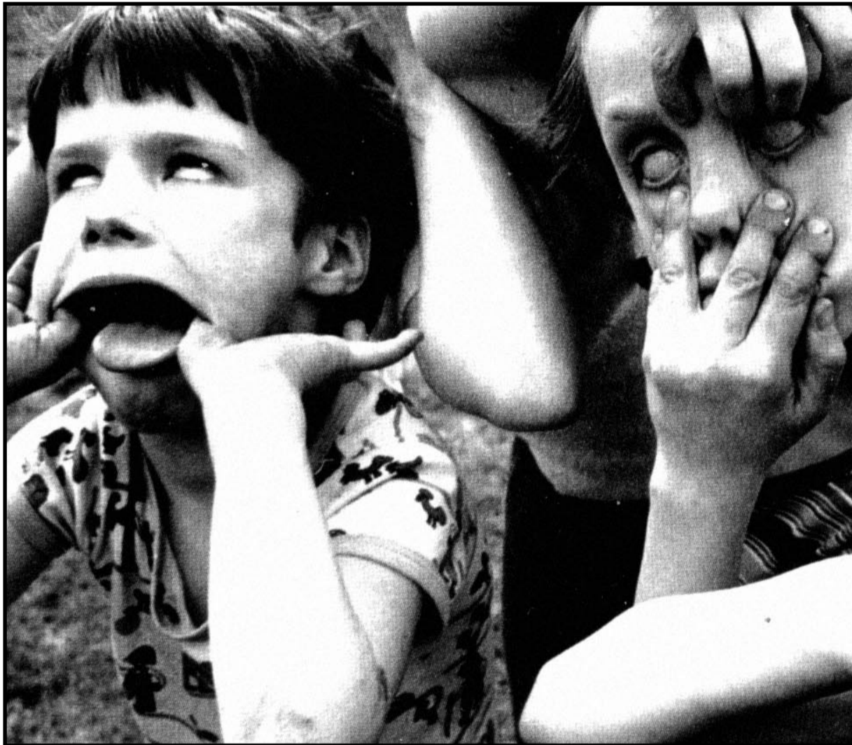
EI MELDING til planleggingskomiteen fra ekspertene.

Ulemper? Kanskje forvirrende for en del barn. Dette skoleåret jobber jeg på første trinn. Vi er fem voksne på 70 barn. De skal ikke knytte seg til én lærer og si «læreren min». Hver lærer må kjenne alle 70, det er ikke enkelt, og det vil ta sin tid bare å lære alle