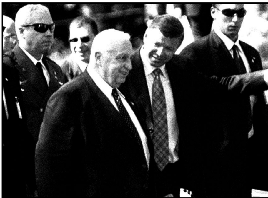
MOLDE, SOMMEREN 2003: Bondevik og Sharon er godt bevoktet, og unngår å møte demonstrantene.

– Det er alternativet jeg synes er skremmende. Jeg ser for meg en kapitalistklasse som klamrer seg til makta, truende, overvåkende og fryktskapende, med fascistiske trekk. Jeg er redd for det. Blir det sterke folkelige bevegelser som krever slutt på at kapitalens