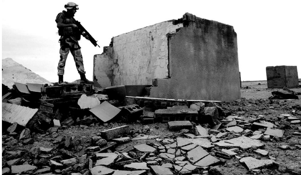
Norsk soldat uskadeliggjør fiendtlig ruin i Irak.

– Eksilirakere i Norge er i ferd med å diskutere hva slags støttearbeid som bør startes. Norske må også på banen og samarbeide med dem. I august/september planlegges det lansering av en politisk motstandsfront i Irak, med en felles politisk plattform. Det vil lette solidaritetsarbeidet i andre land, for da vil det være noe synlig vi kan støtte. Da oppfordrer jeg folk som ønsker å få slutt på USAs okkupasjon av Irak, om å danne solidaritetskomiteer over hele landet. Kampen i Irak vil få mye å si for framtida til folk flest verden over.