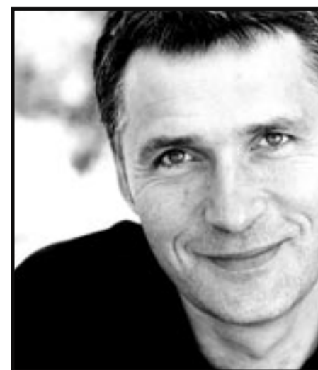
PLANEN KLAR! Stoltenberg har klare planer for norske investeringer...