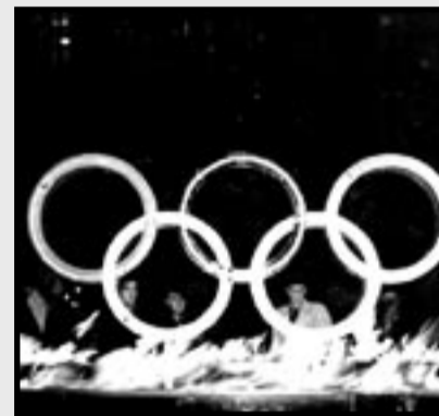
HUSKER DU OL i 1952? Du slipper ikkje unna likevel ...

Avisene er fulle av at folk født før 1950 ikke vil omfattes av reformen. Men det stemmer ikke. Dette gjelder også dem: Forslagene om innsparinger gjennom å innføre delings-tall som reduserer pensjonene etter forventet levealder for hvert årskull. Forslaget om at pensjonen skal følge gjennomsnitt av lønns- og prisutviklinga. Forslaget om at fleksibel pensjonsalder med redusert pensjon skal gjelde fra 2010.