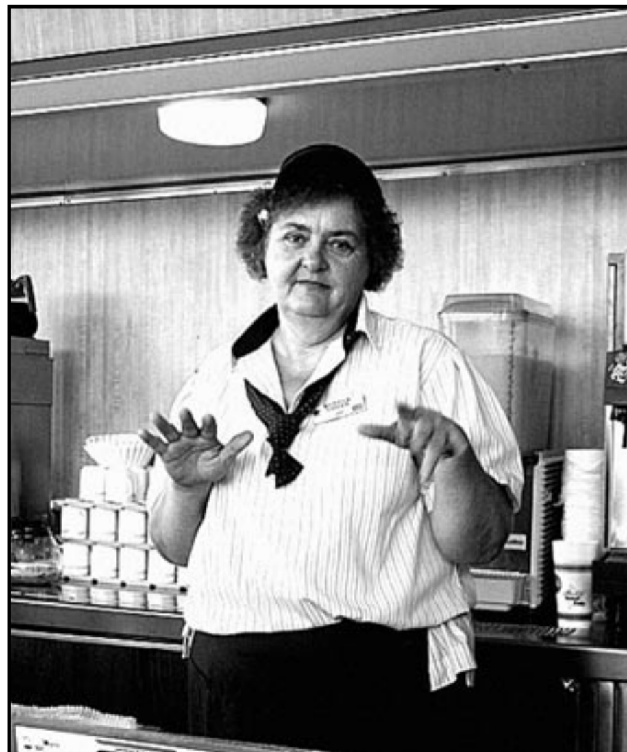
Saken er biff!

Hexa Alexa har gitt mange råd til arbeiderkvinner. Du kan se alle her: www.akp.no/emneregister.html