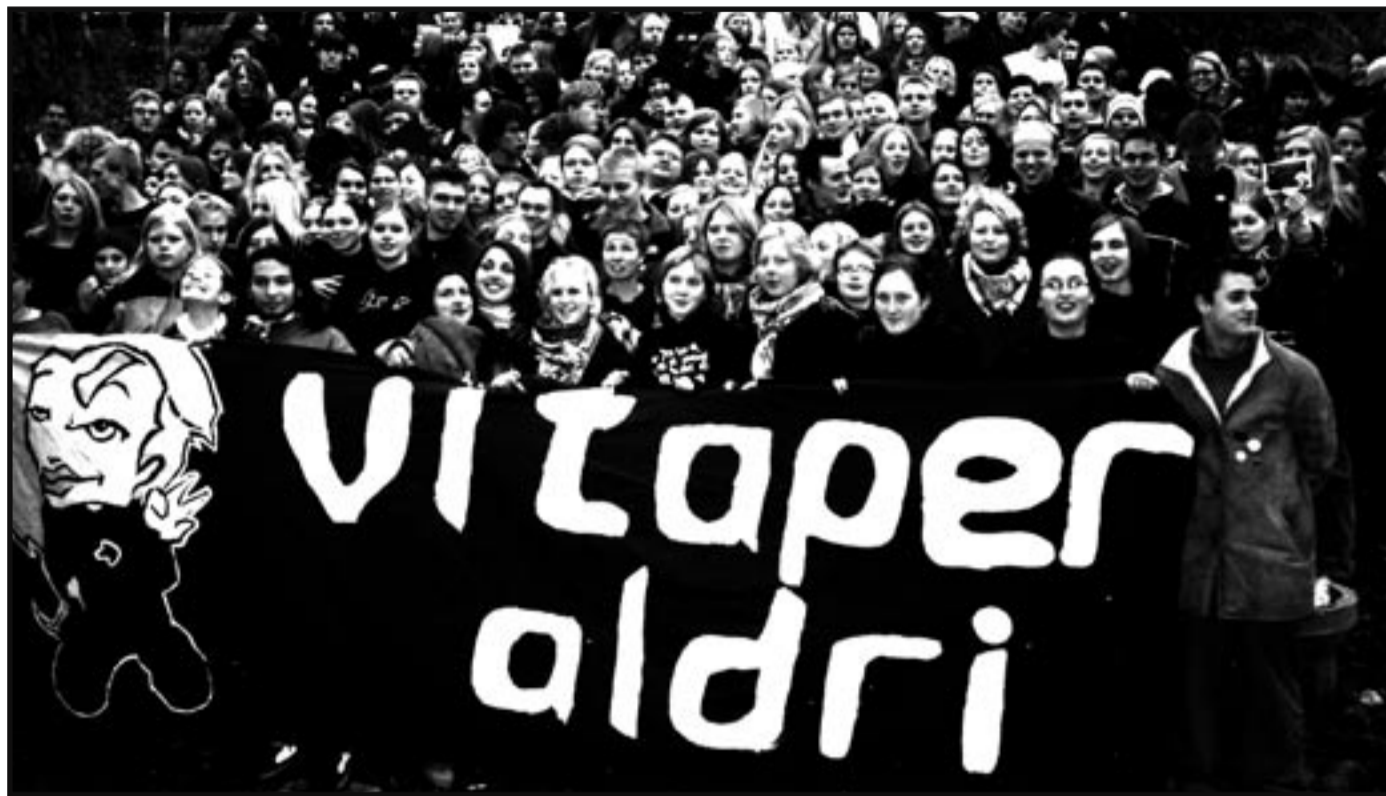
EU-SAKA ER VIKTIG FOR pensjonssystemet i Norge. Bilde fra ungdomskonferansen «Vi taper aldri» 2004 mot EU.