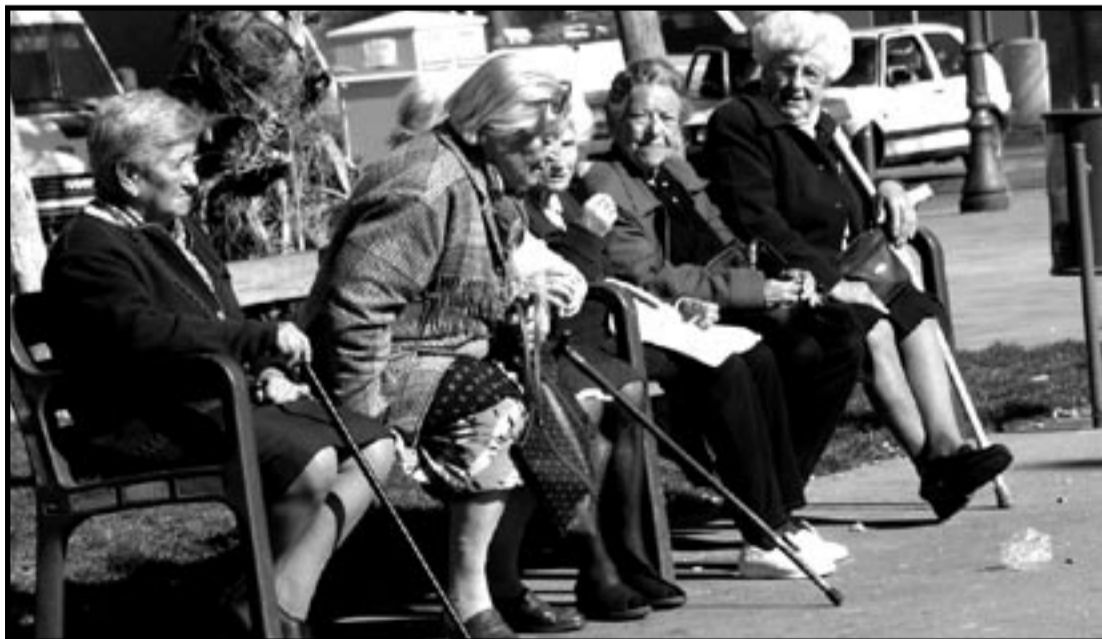
Folketrygda gjelder for alle arbeidsfolk, hele livet.

«Høyere minstepensjon er fortsatt det viktigste kravet å stille. Minstepensjonen er nå