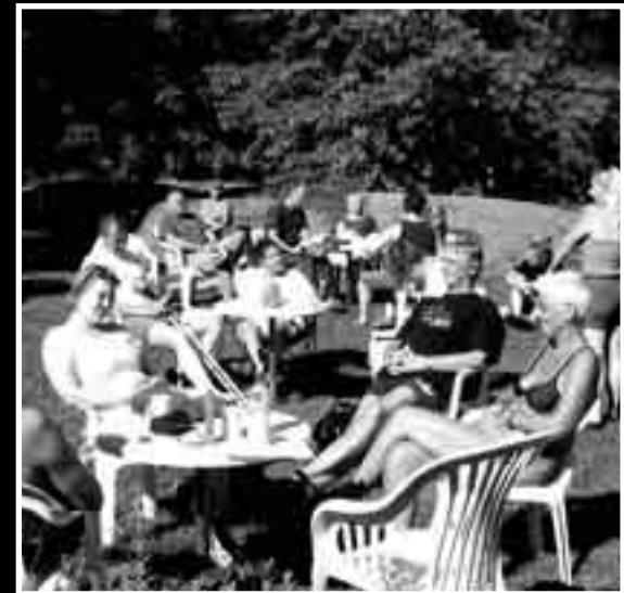
Diskusjoner i sola