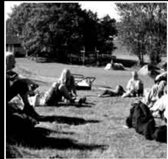
Alltid fint vær. Strand leirsted, Sandefjord