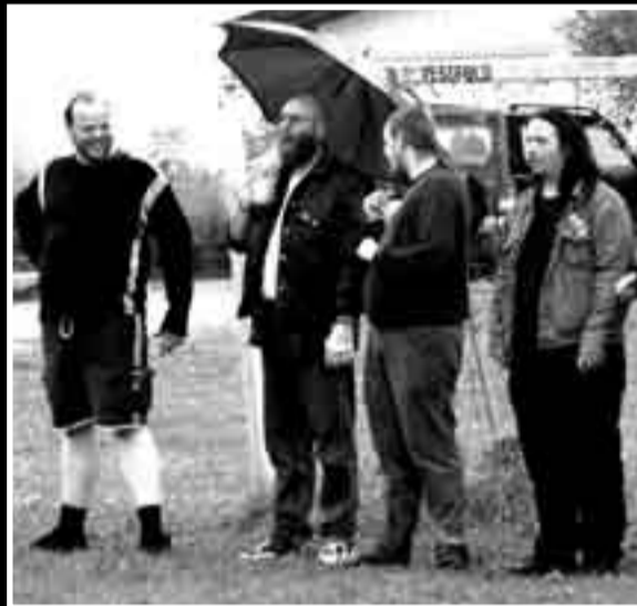
Kjække gutter solidarisk foran mål