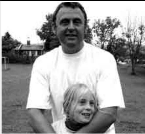
Far og datter stortrives