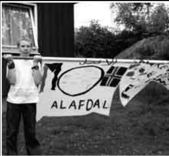
Men barna vant fotballkampen