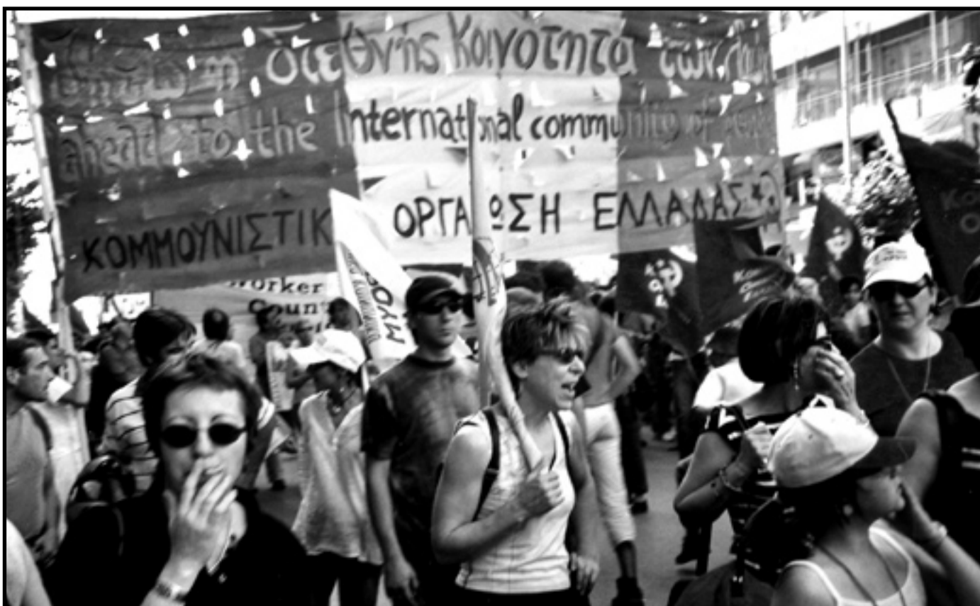
Ein av seksjonane i laurdagsdemonstrasjonen i Thessaloniki

Per Gunnar Skotåm skal innleia om rivaliseringa mellom EU og USA på Raud sumarleir .