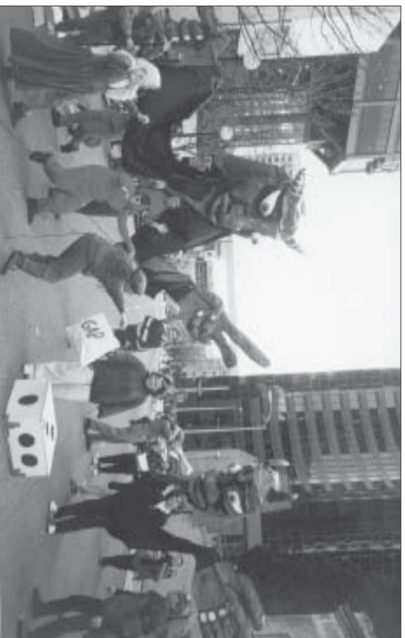
Fra Seattle 1999

Kapitalismen har for lenga sida utvikla seg til aggressiv imperialisme. Dersom dette systemet ikkje fjernast, vil teknologiske framskritt og internasjonalisering i fyrste rekke føra til auka utbytting, undertrykking, krig og åtak på livsgrunlaget til menneska og anna liv på jorda.