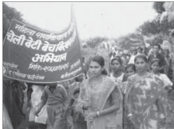
Kampen føregår verda over: Demonstrasjon mot prostitusjon i Nepal